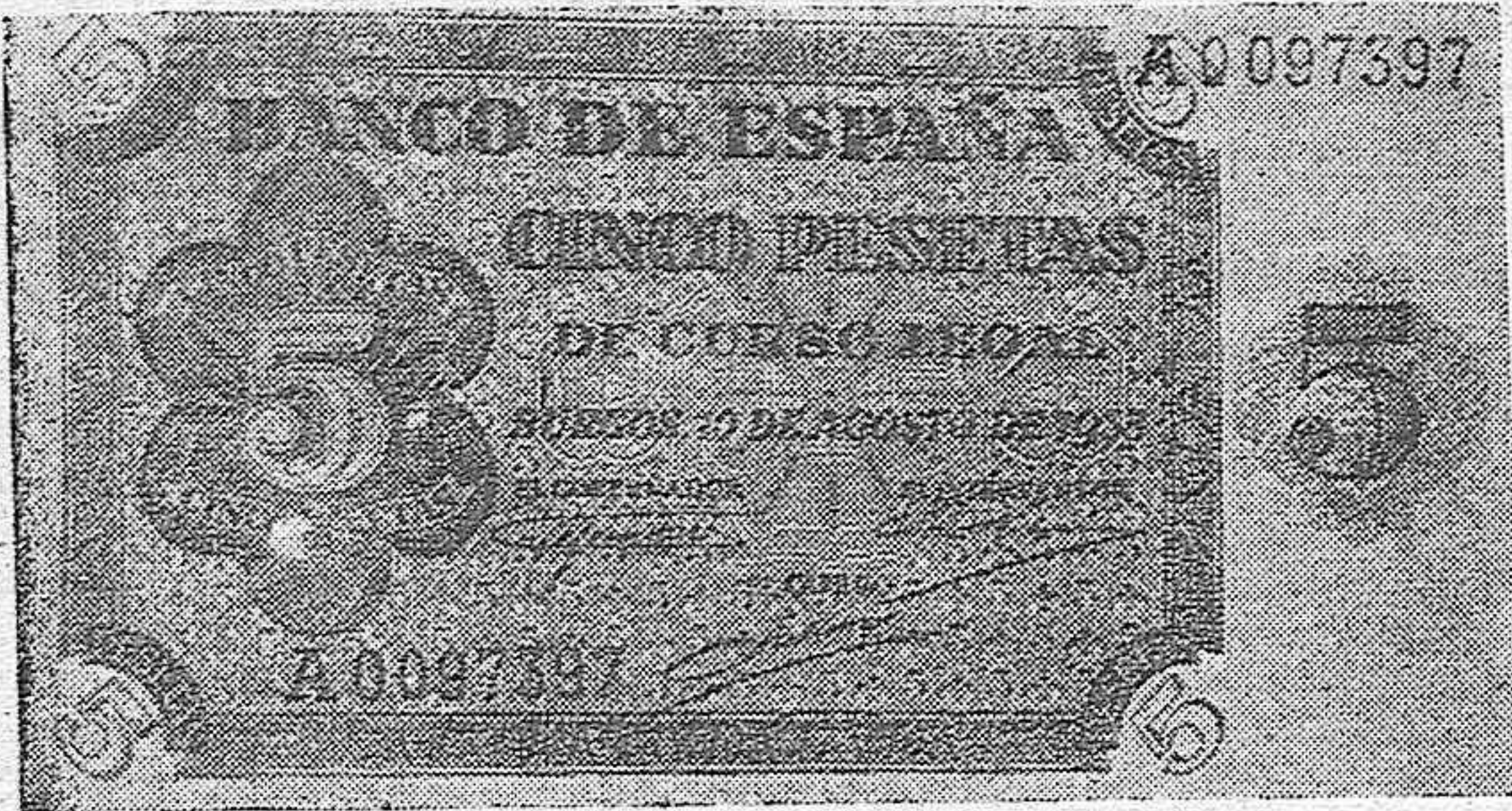
El nuevo billete de cinco pesetas puesto en circulación por el Banco de España.