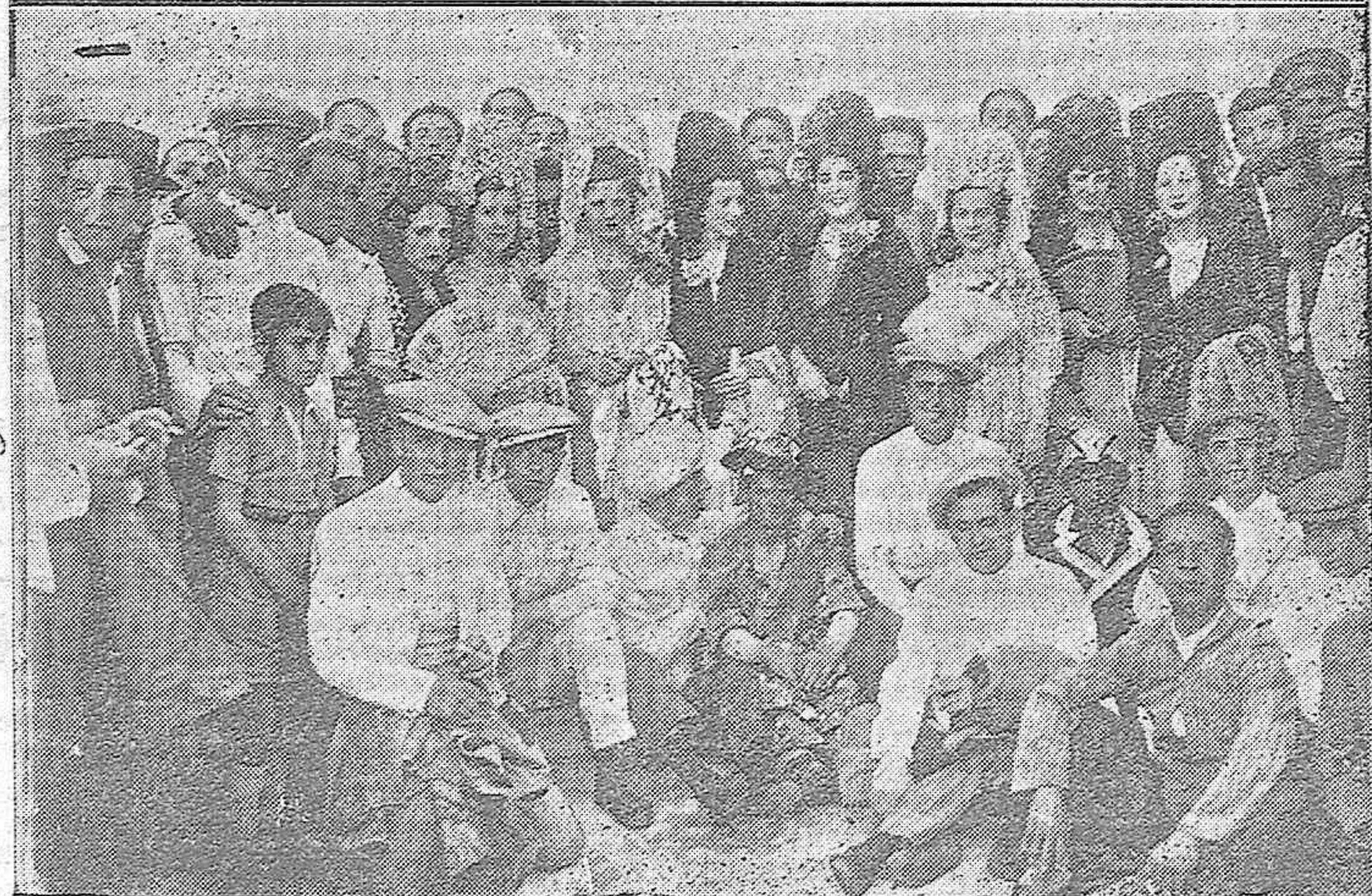
EL FESTIVAL TAURINO A FAVOR DEL COMEDOR DE CARIDAD.—Bellas señoritas dirigiéndose a la Plaza de Toros para presidir el festival organizado por los taxistas.—Grupo de taxistas que tomaron parte en la fiesta taurina