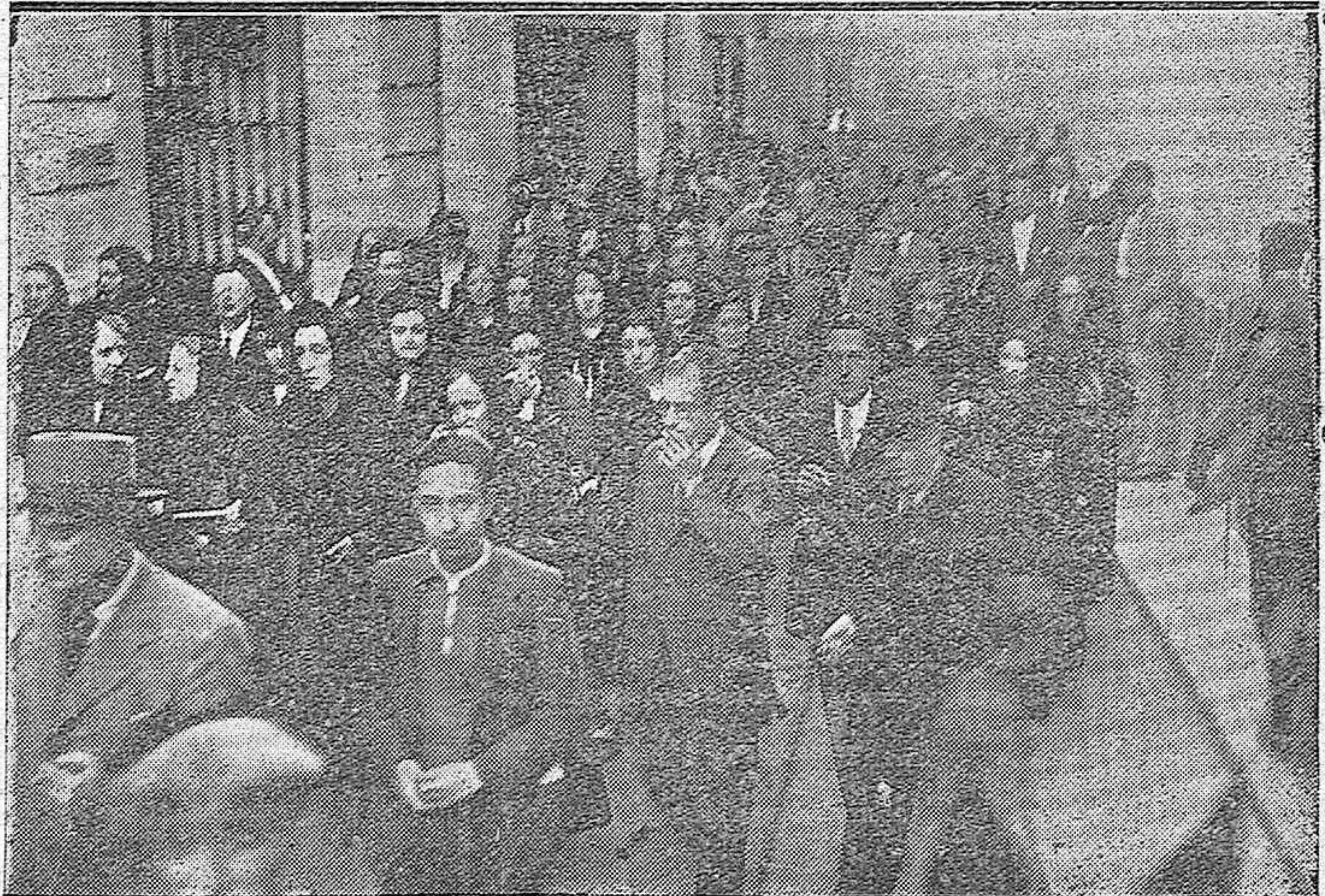
Arriba. —Aspecto del exterior del templo de San Salvador y Santo Domingo de Silos, a la salida de los funerales que se han celebrado en el mismo, esta mañana, por los que murieron en defensa de España y la República, en los sucesos revolucionarios.— Abajo: Otro aspecto de la salida de los funerales.