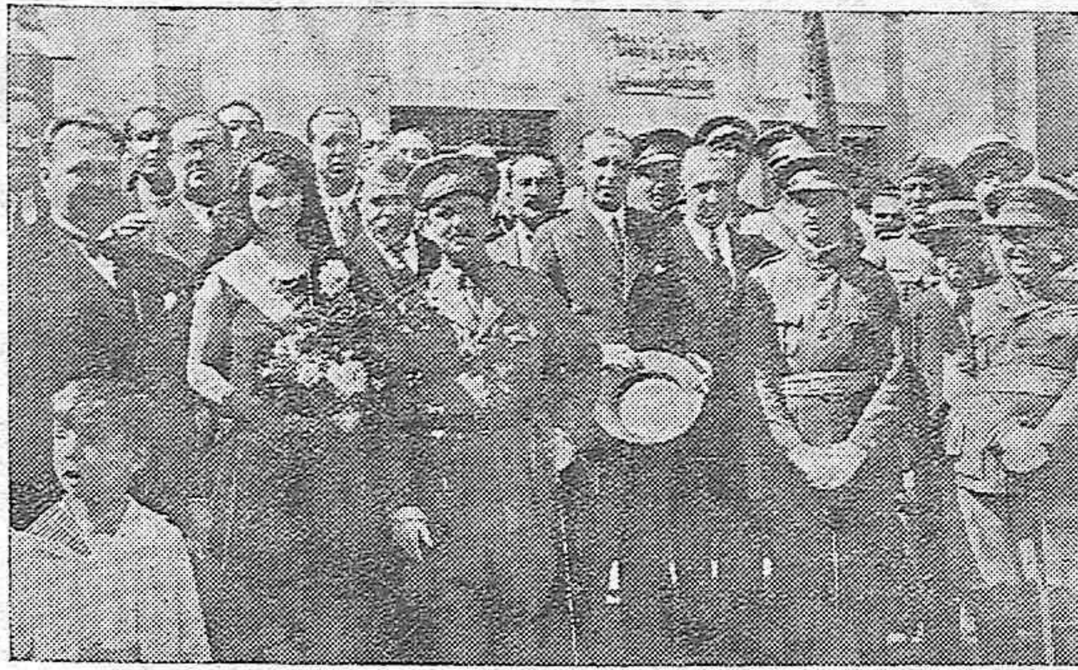
Las autoridades presidiendo el acto.