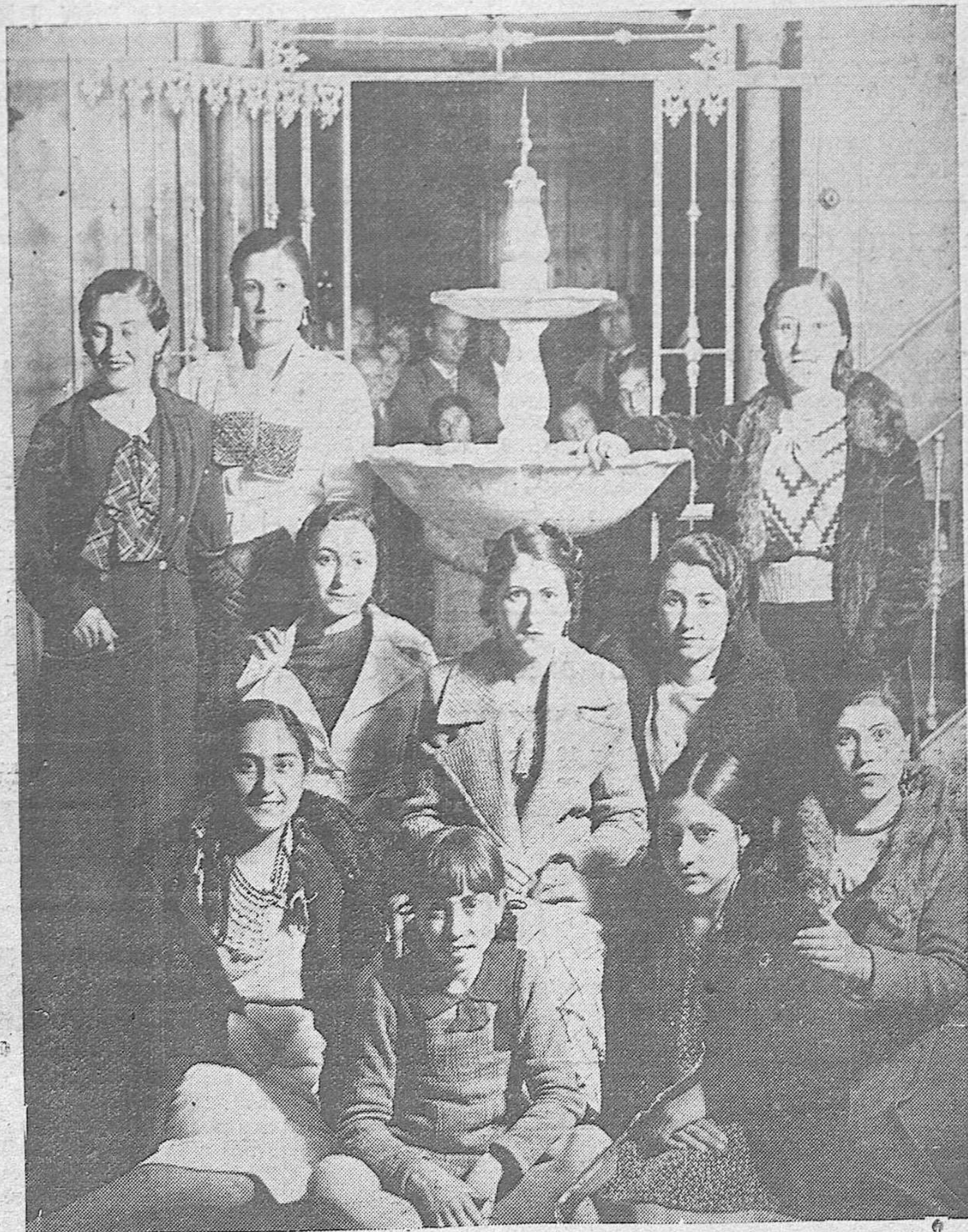
En Hinojosa del Duque: Grupo de señoritas de la localidad que tomaron parte en una fiesta celebrada en dicha población.