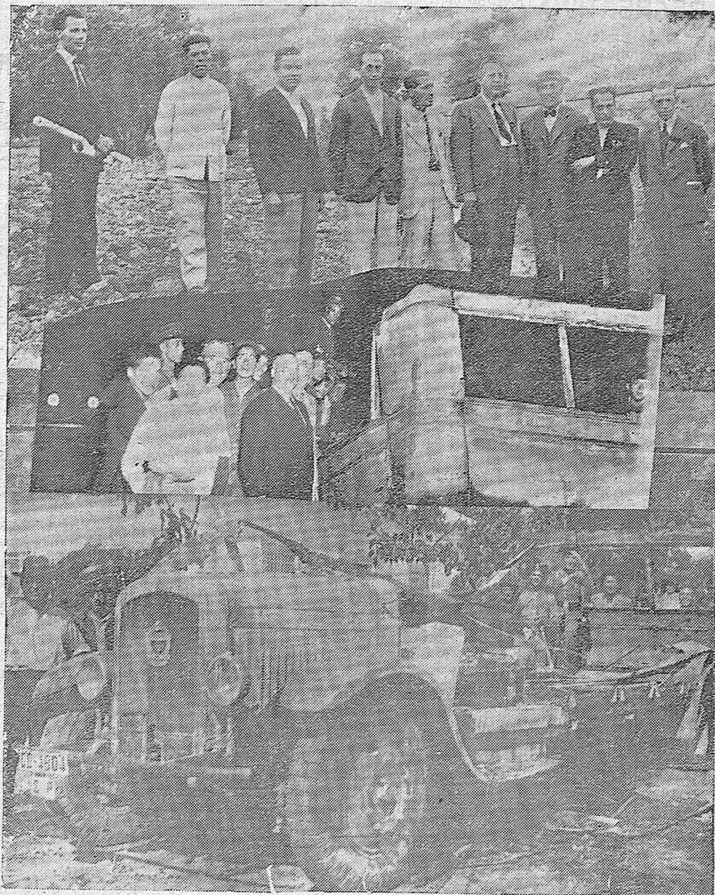
ARRIBA: Visita de la Comisión Gestora de la décima para el paro obrero a la Estación Penitenciaria con el fin de estudiar el trazado de la carretera de Córdoba a dicho Centro Oficial.—EN EL CENTRO: El autobús incendiado anoche en la Carretera del Brillante.—ABAJO: Estado en que quedó dicho vehículo.