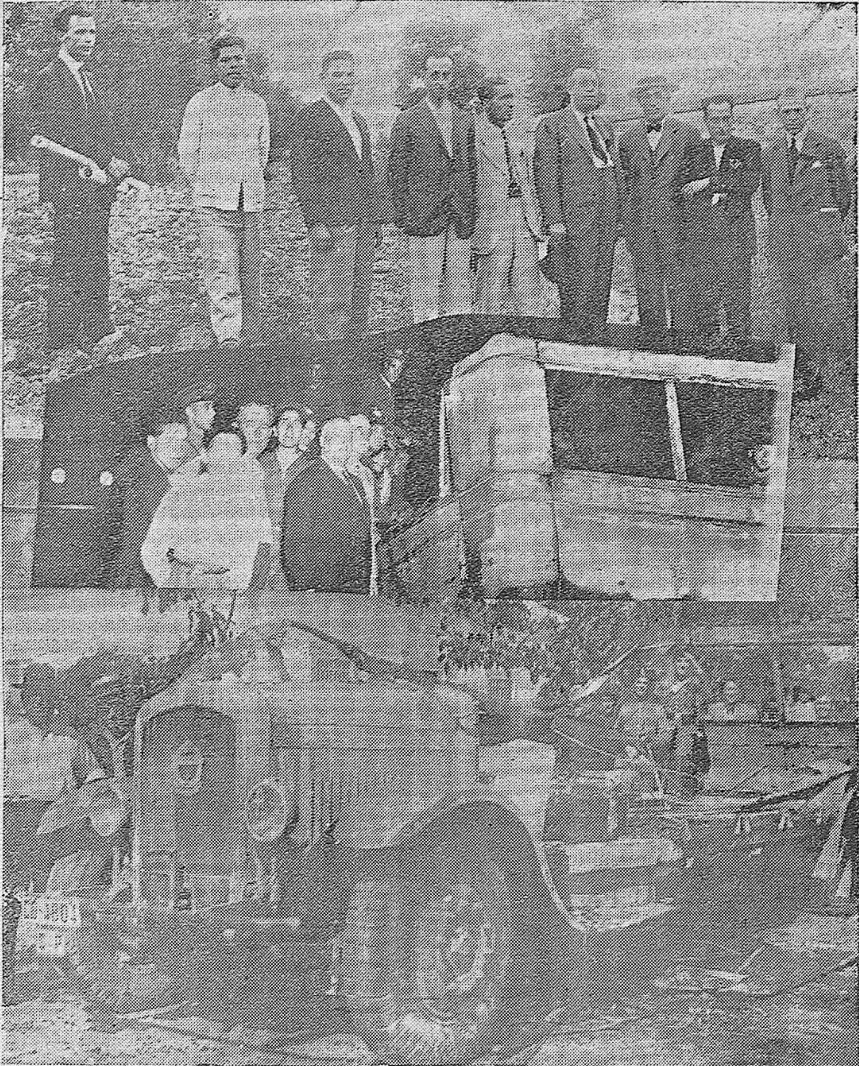
ARRIBA: Visita de la Comisión Gestora de la décima para el paro obrero a la Estación Pecuaría con el fin de estudiar el trazado de la carretera de Córdoba a dicho Centro Oficial.— EN EL CENTRO: El autobús incendiado anoche en la Carretera del Brillante.—ABAJO: Estado en que quedó dicho vehículo.