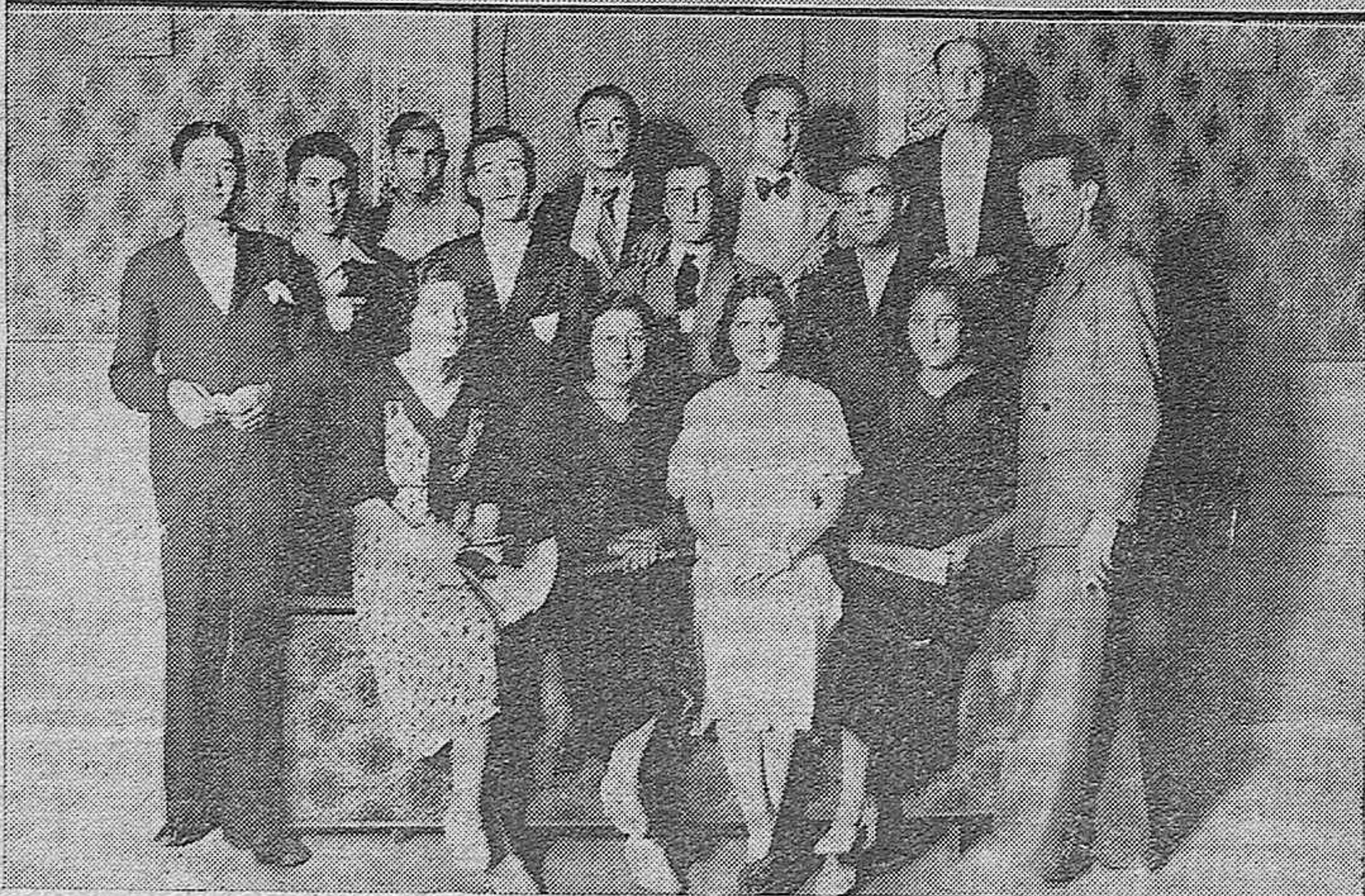
ARRIBA: Los señores que forman la Comisión Gestora de la Asociación Provincial al terminar la última reunión a la que asistieron en pleno.—ABAJO: Algunos de los jóvenes que forman la nueva agrupación teatral, titulada Guerrero Mendoza.