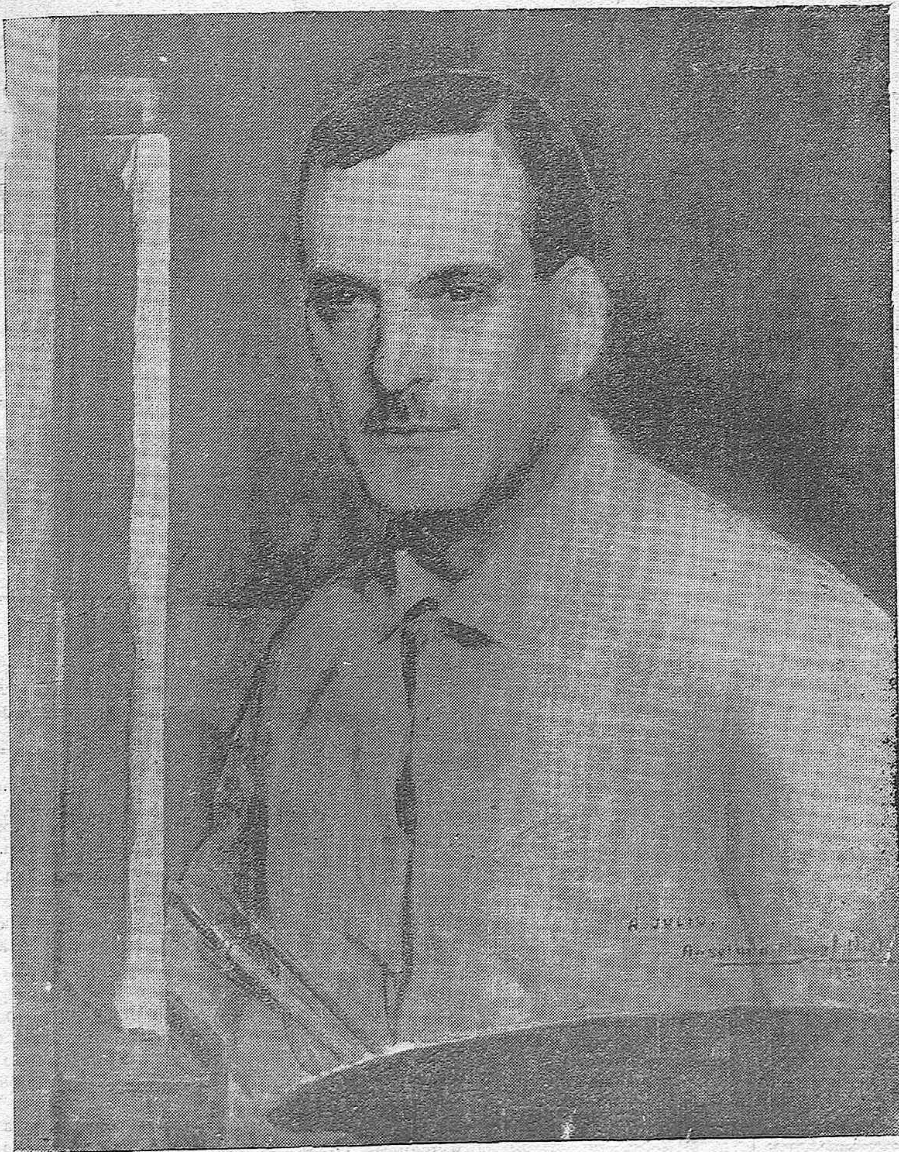
EN EL SEGUNDO ANIVERSARIO DE LA MUERTE DE JULIO ROMERO.—Retrato inédito del pintor de las mujeres, homenaje póstumo del notable artista Anselmo Miguel Nieto