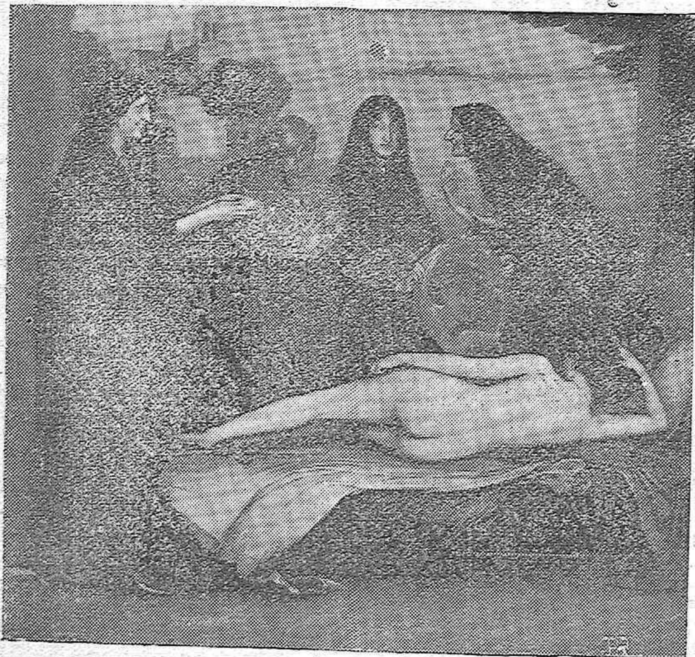
“EL PECADO”.—Uno de los lienzos últimos del llorado maestro. La fragancia de la juventud, el encanto de la belleza, comentados y satirizados por viejas brujas, encarnación de lo arcáico