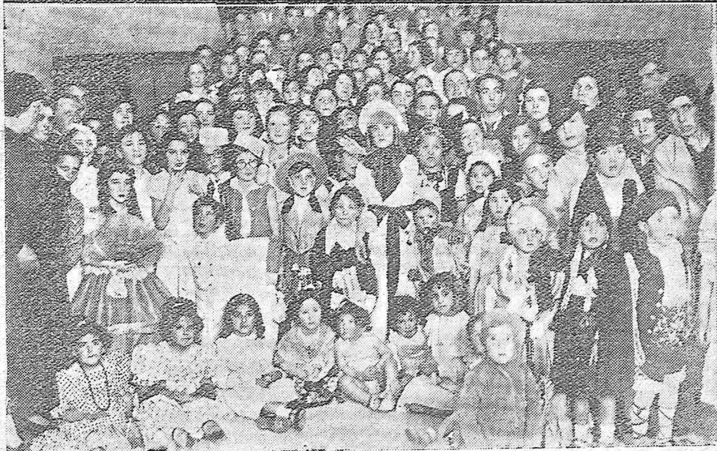
Arriba: Niños con bonitos disfraces que asistieron al concurso infantil en el Centro Filarmónico "Eduardo Lucena".—Abajo: Festival infantil celebrado en el Círculo de la Amistad.