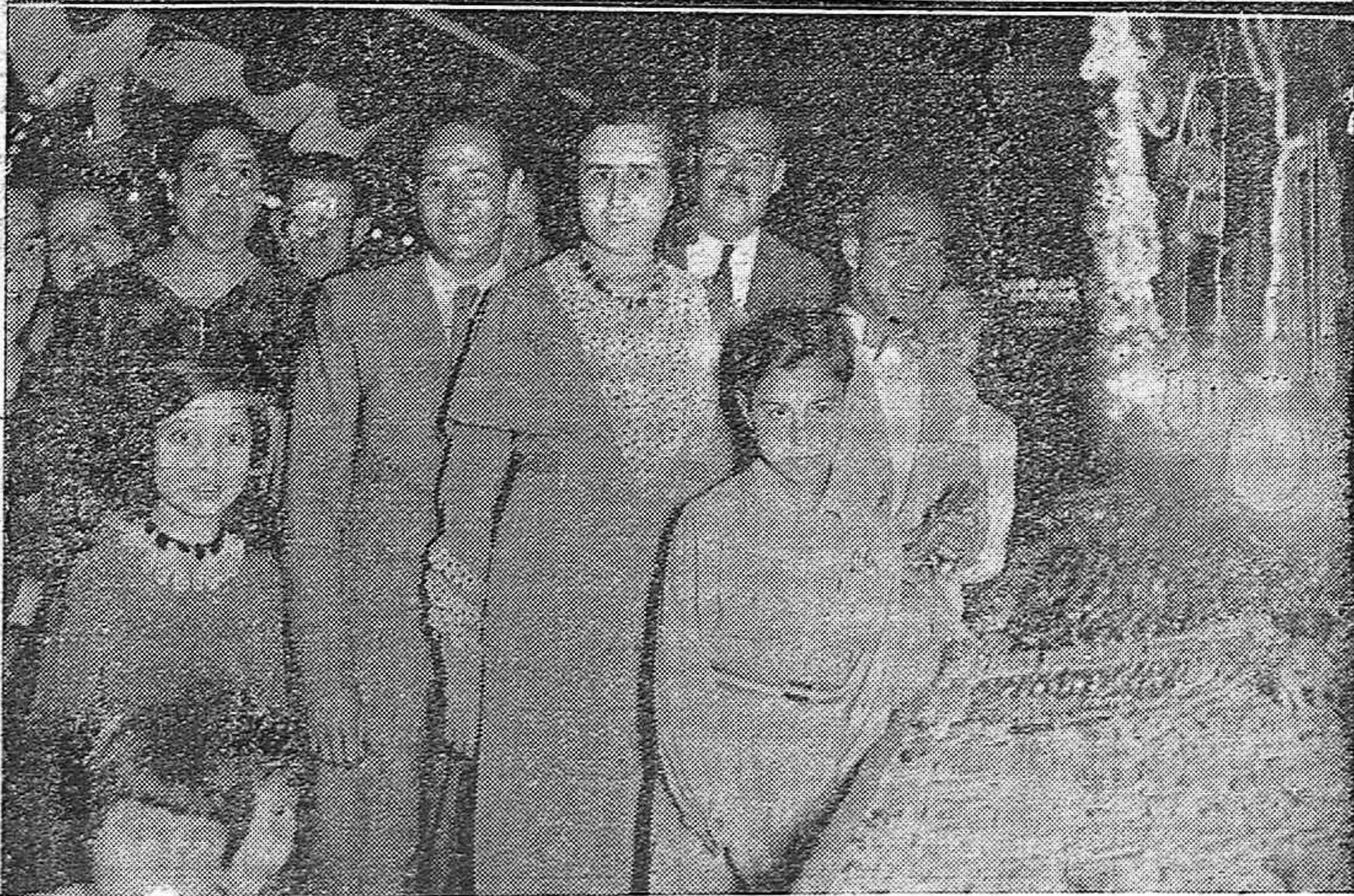
EPILOGO DE LA FERIA EN AGUILAR DE LA FRONTERA. —Miembros del comité local del partido radical reunidos en simpática camaradería en su caseta de la feria.—Una bella aguilarense, admirada cliente de uno de los "puestos del serrín" tan populares y concurridos en toda clase de festejos, de los que son ya algo imprescindible