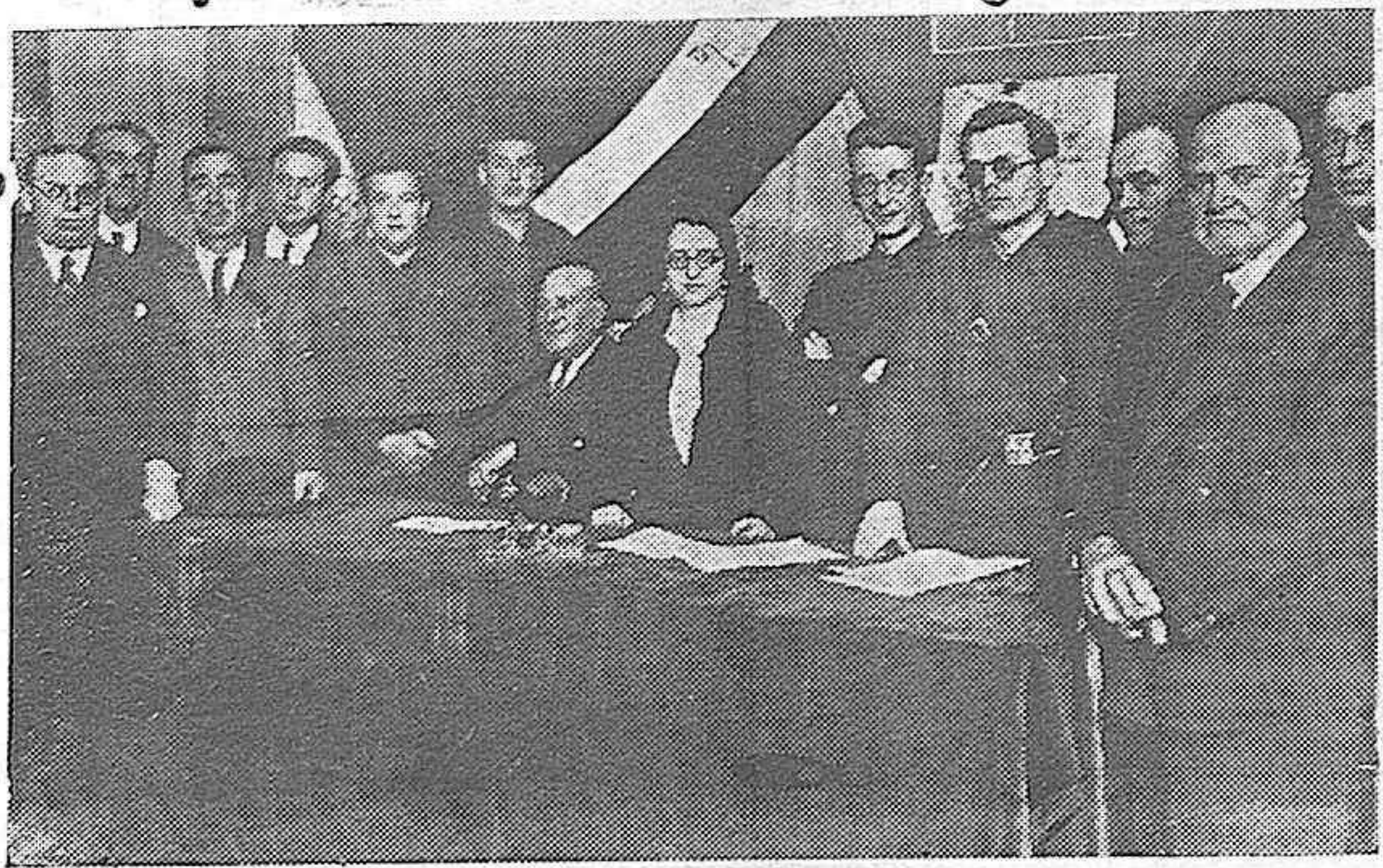
Los profesores de instrucción pública y mandos de Juventudes de Falange en la reunión convocada por el Delegado Provincial de O. J. para cumplimentar disposiciones de la Dirección Nacional de Enseñanza.

La revista de la juventud del estudio, aparecerá en breve.