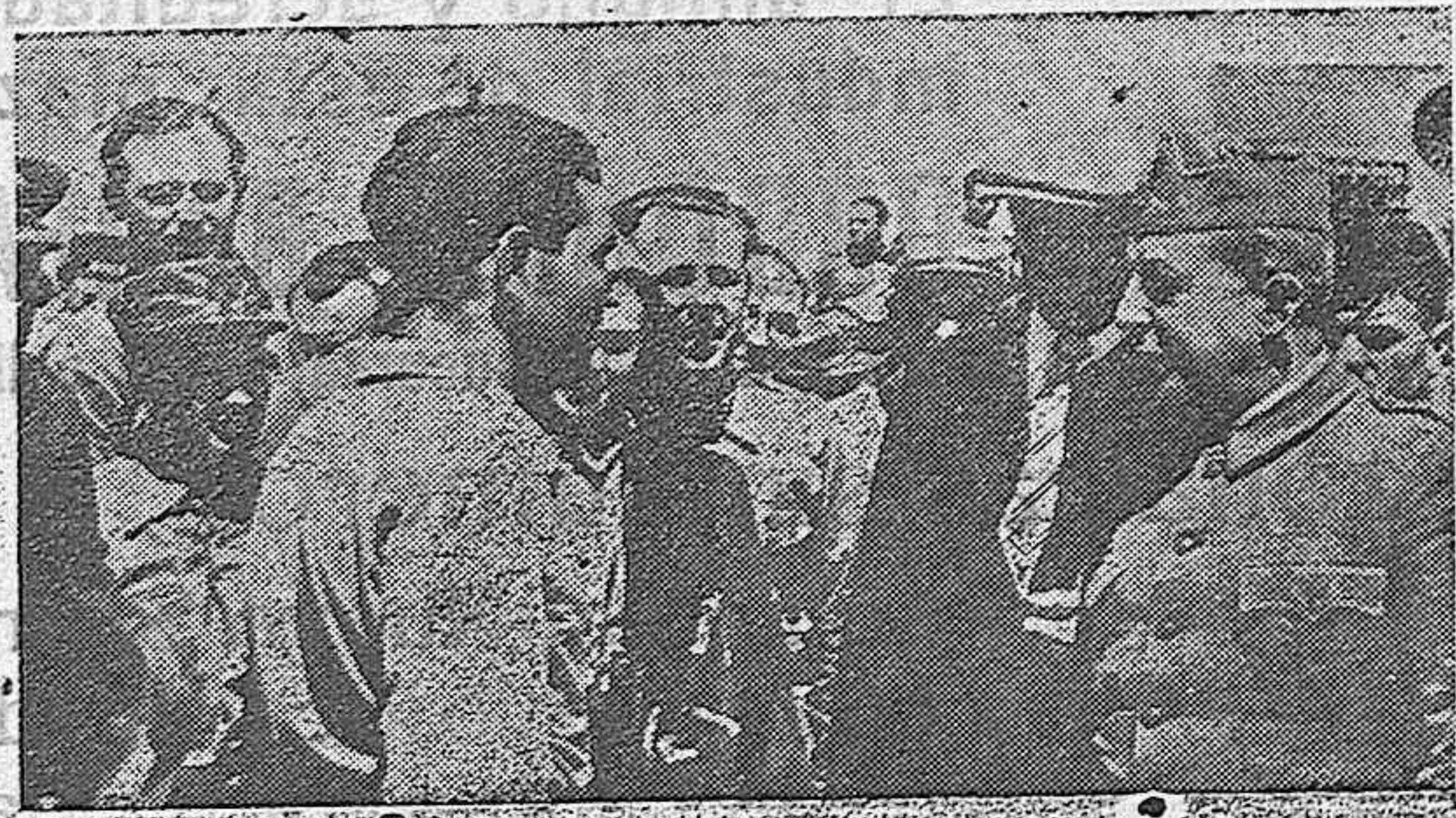
Pozas—nombre que será siempre imperdonable en los días futuros—conversa en el frente de Aragón con la husma internacional, mientras su amo, el apache de la gorra, vigila sus palabras.

M. ENRIQUEZ ROMA Enero. Segundo Año Triunfal.