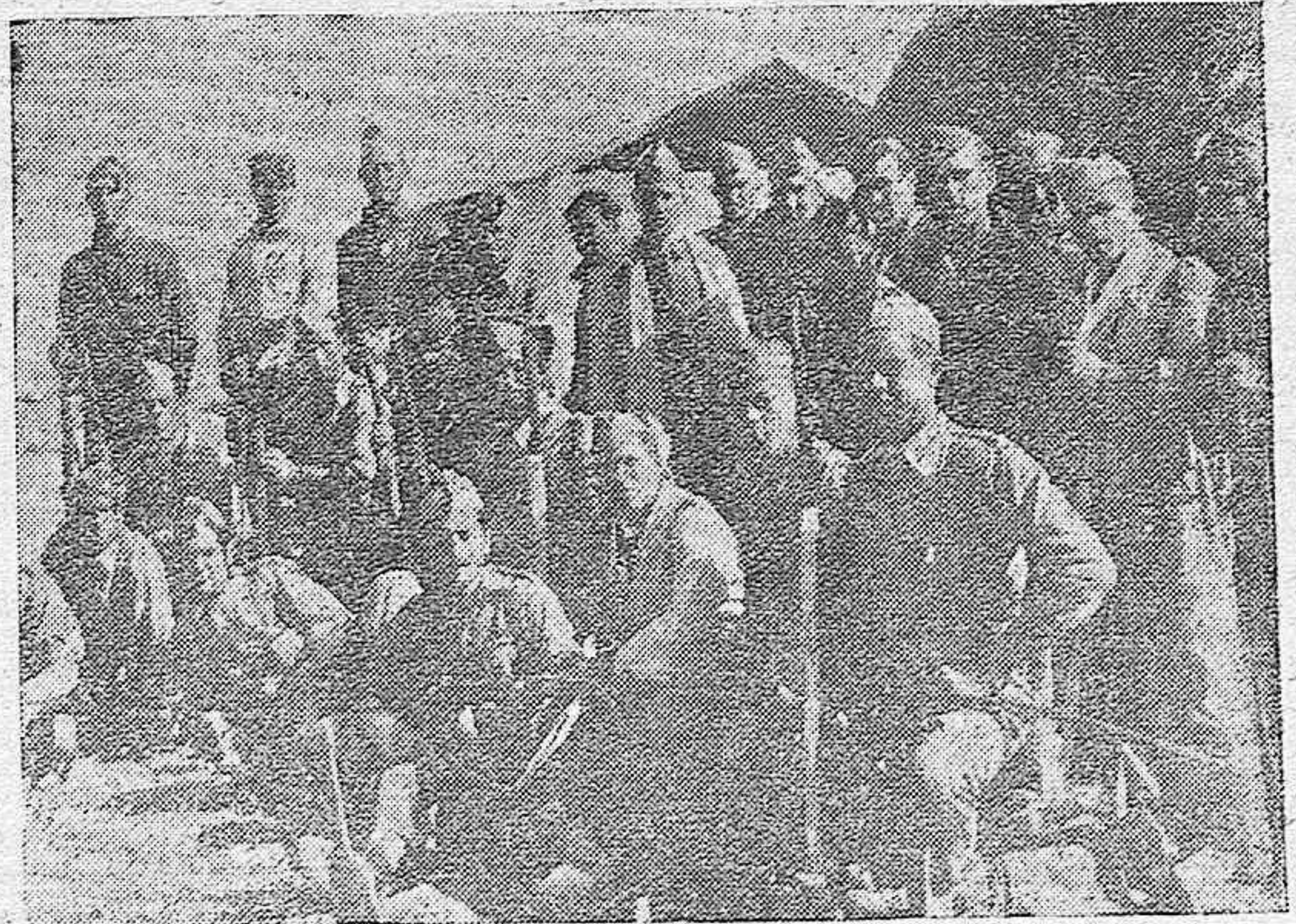
La Artillería en la lucha contra los rojos, se distingue por su heroicidad.