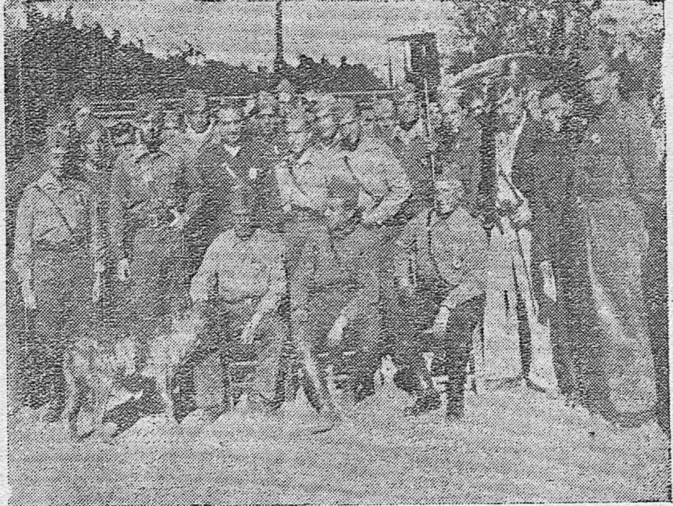
Fuerzas de Infantería de Marina, en el frente, defienden a España.