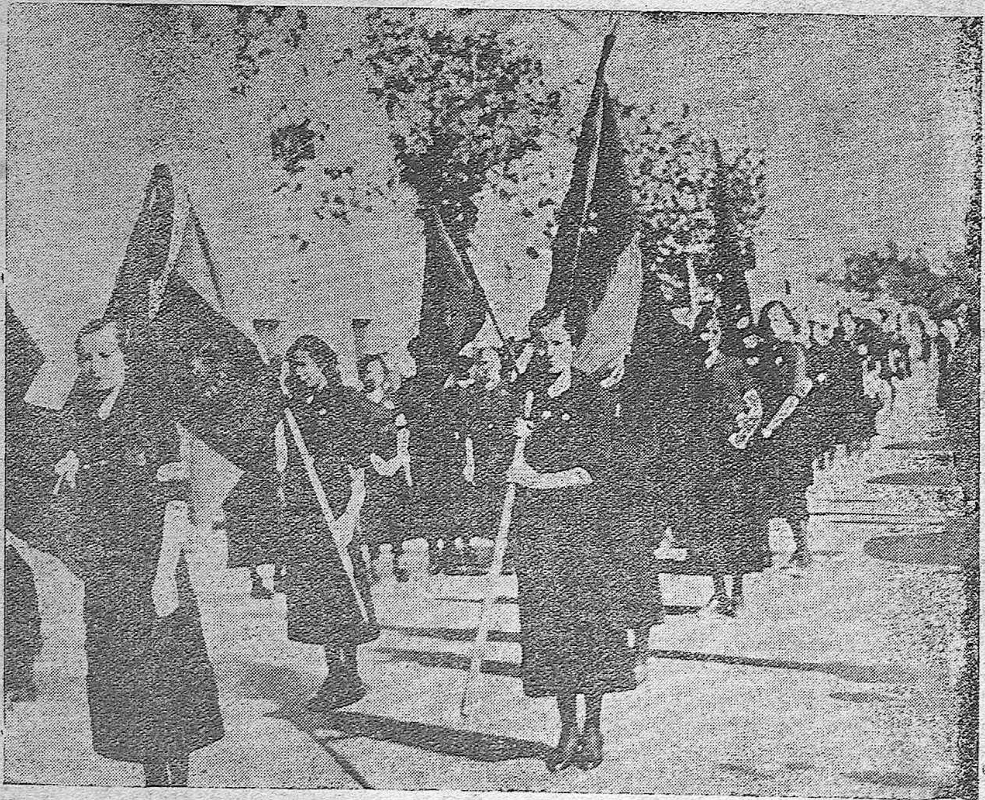
Las secciones femeninas de Falange, de Córdoba y la provincia, en el magnífico desfile del 29 de Octubre.