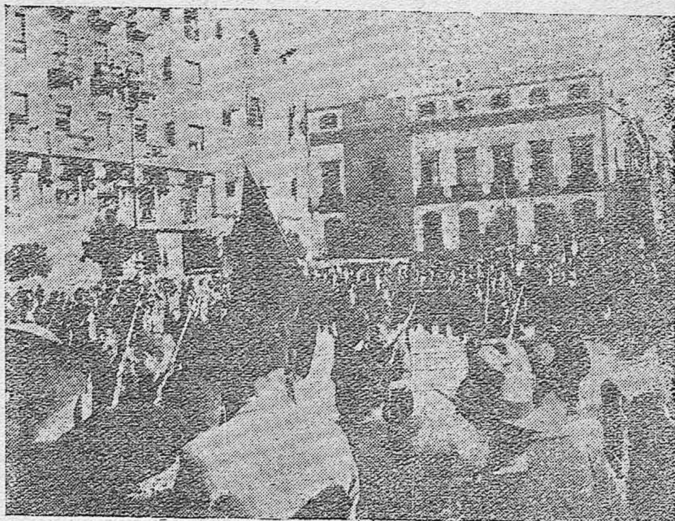
Desfile de Falange por la Plaza de José Antonio Primo de Rivera, en la fiesta del 29 de Octubre.