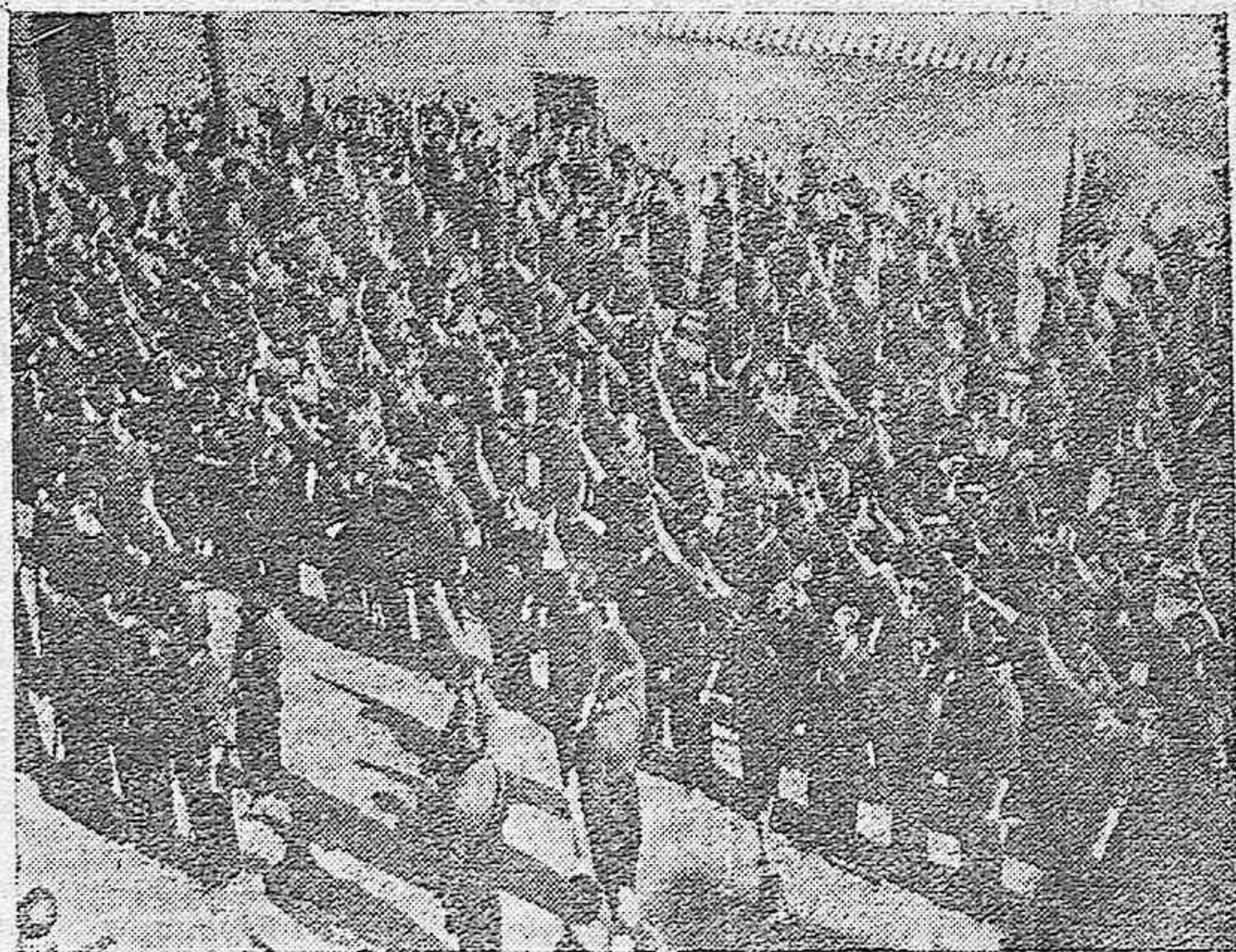
Falange, entonando su himno glorioso, en el Cuartel.