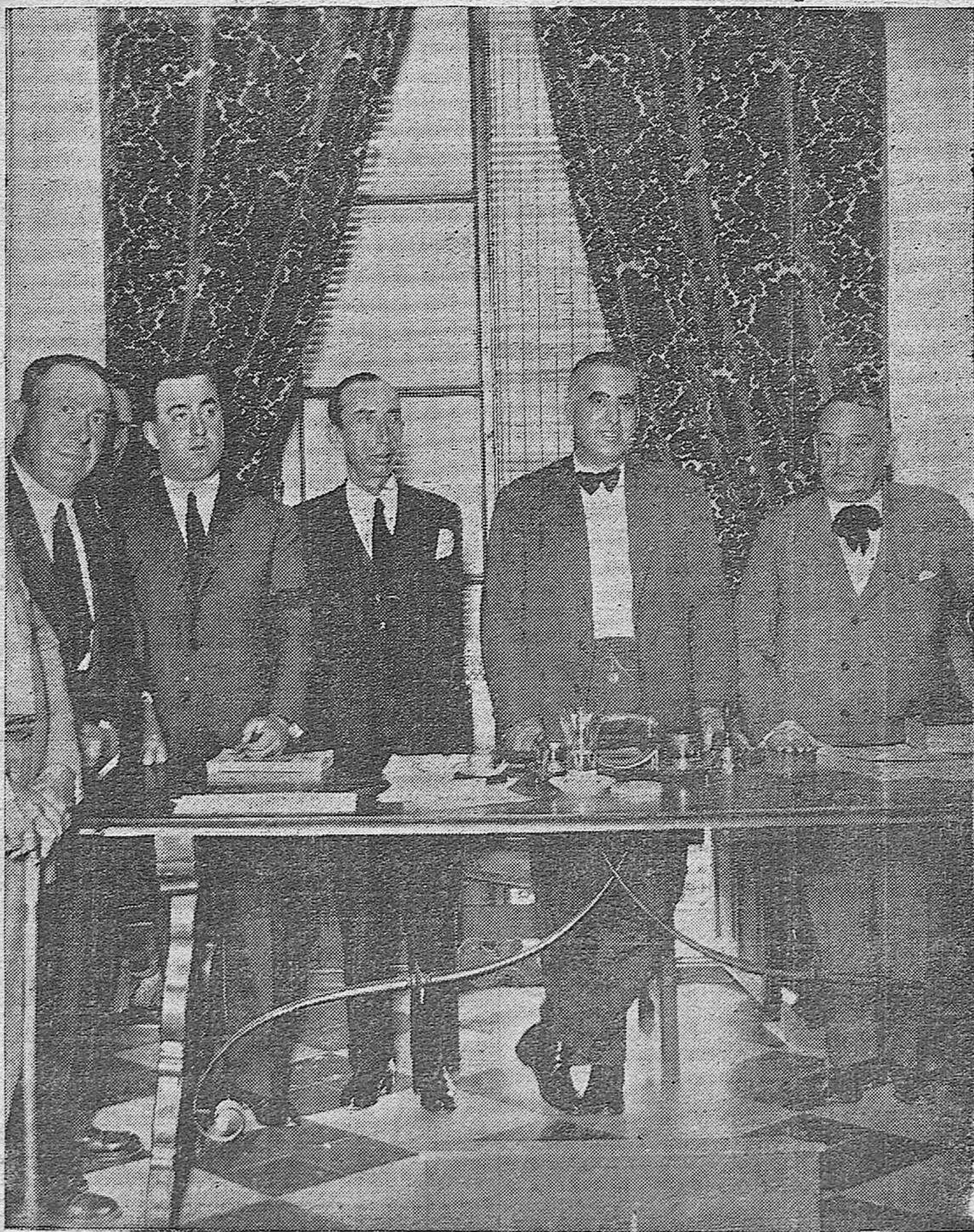
EN LA CAMARA AGRICOLA.—La presidencia de la importante reunion celebrada ayer en la que se trató de la exportación a otras regiones de nuestra abundantísima cosecha triguera