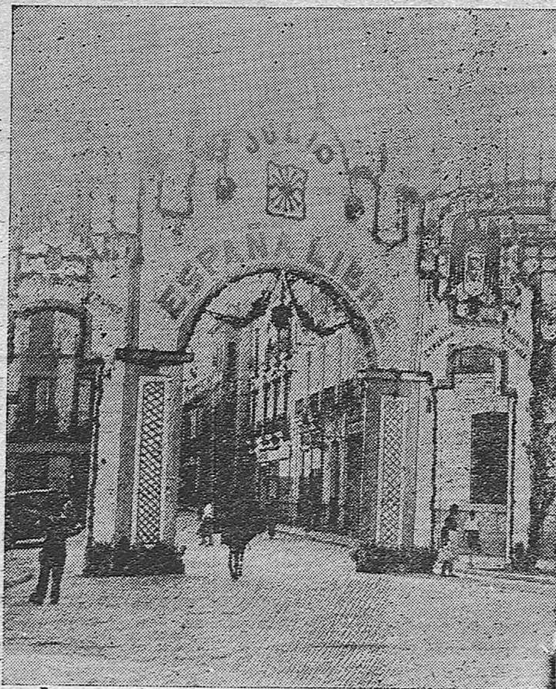
El arco levantado en la Puerta de Gallegos conmemorativo de las históricas fechas del 17, 18 y 19 de Julio.

de Madrid, nuestro recuerdo y nuestra admiración al cumplirse los dos años de sacrificio.