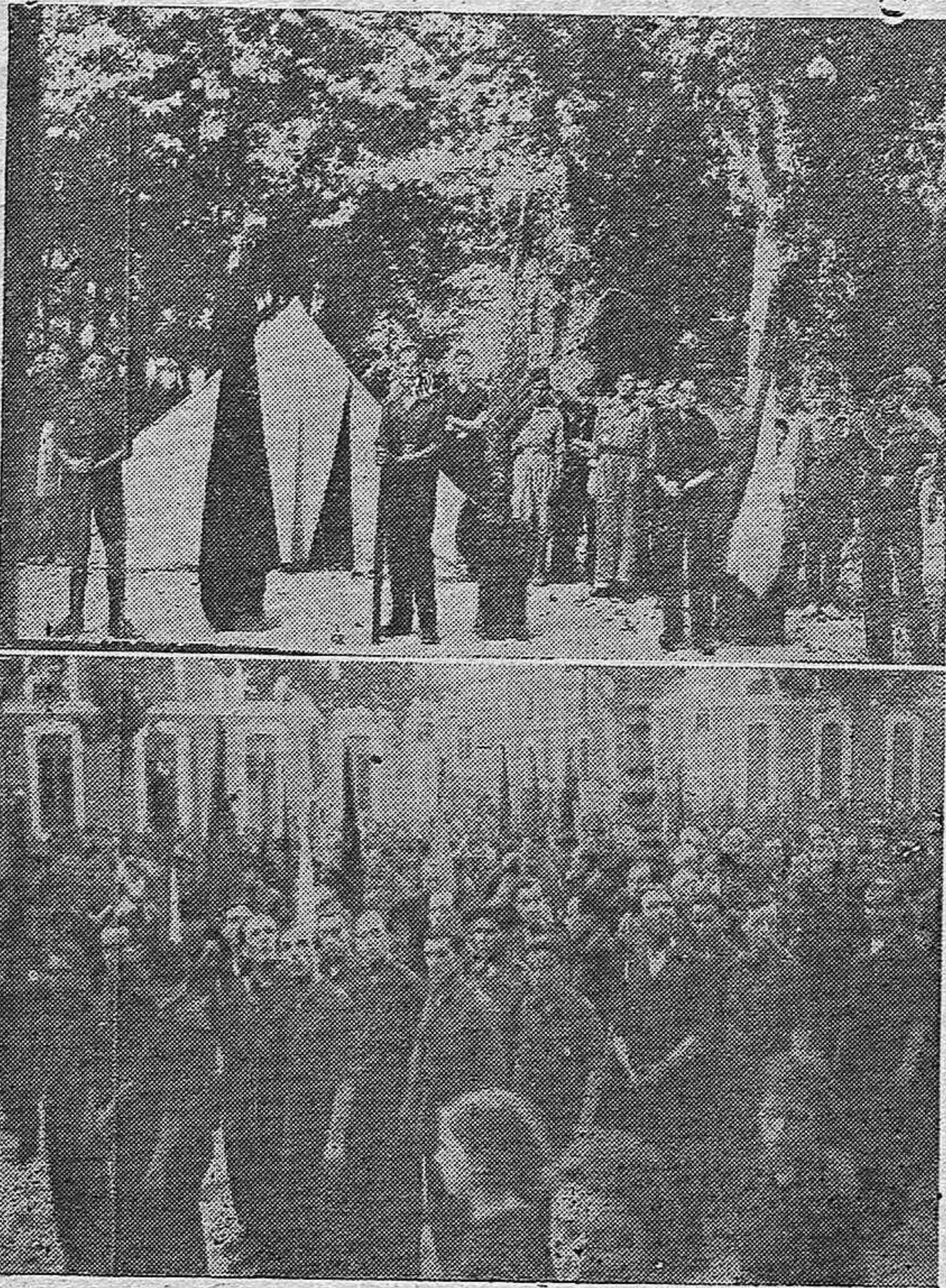
Los Flechas en el Campamento Marroquí.—Un aspecto de la Concentración en el Paseo de la Victoria.