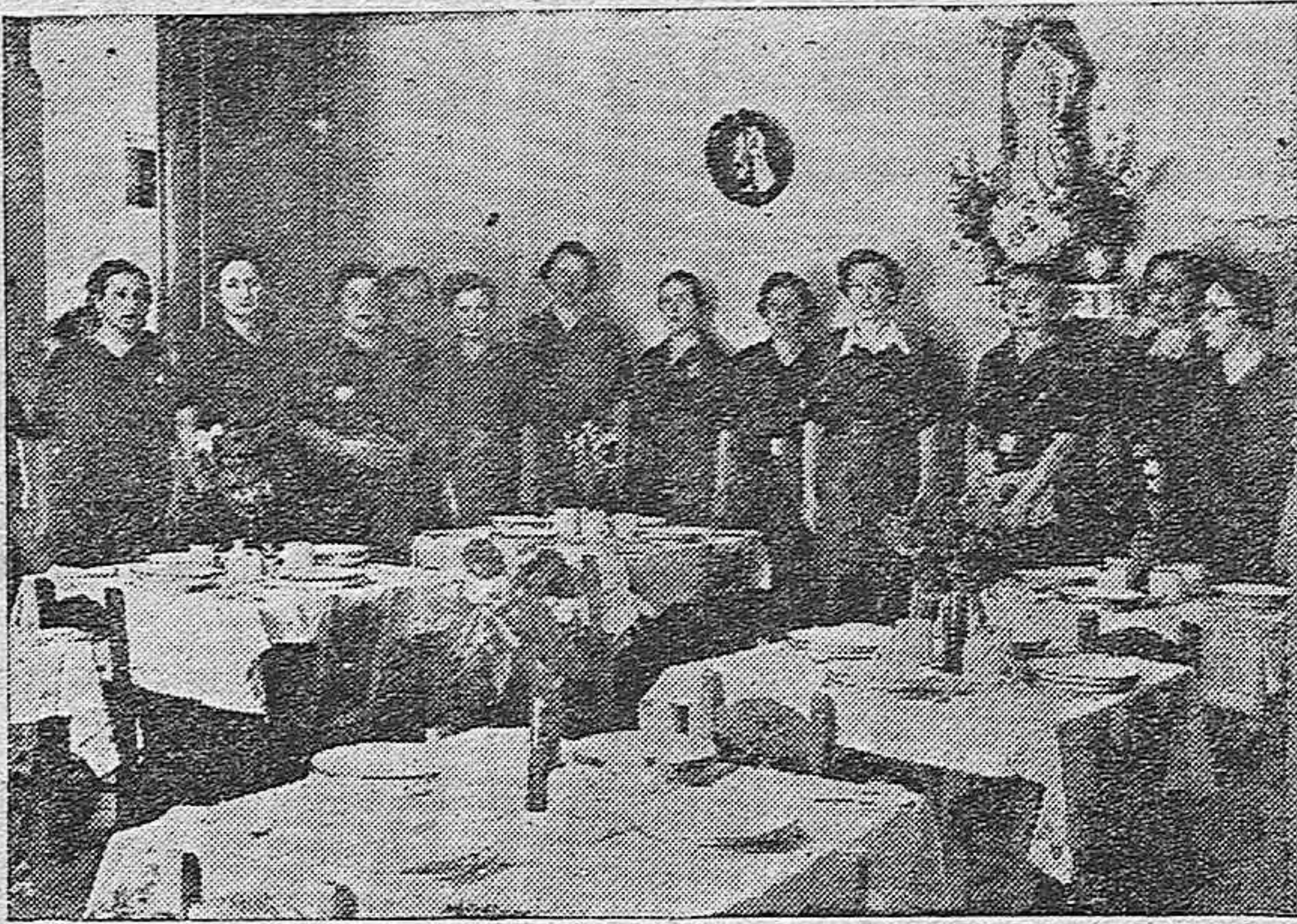
Los mandos provinciales de la Sección Femenina de F. E. T. de Córdoba visitaron en Cabra el Comedor de Auxilio Social.