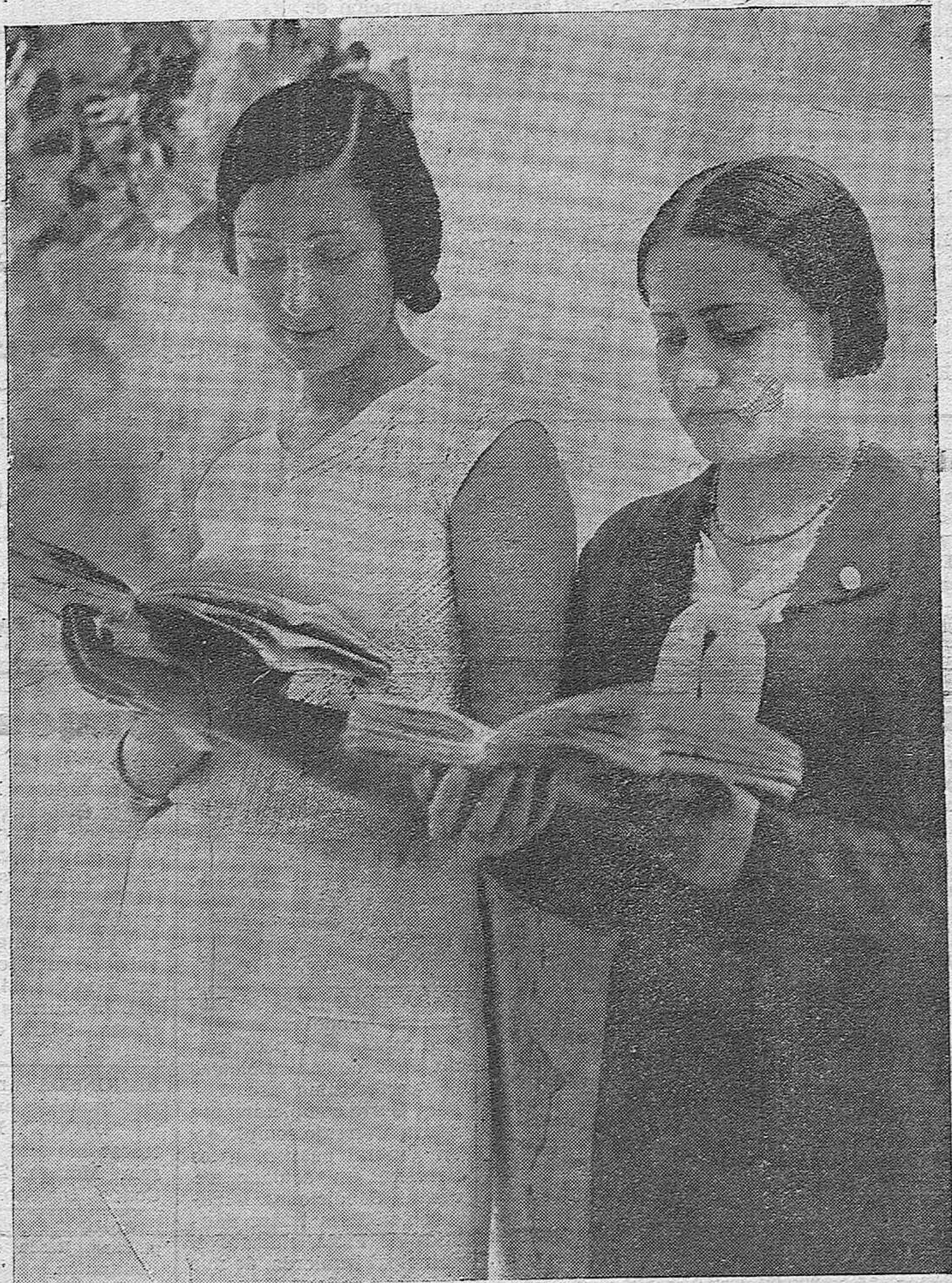
CORDOBA CULTURAL.—Dos bellas jóvenes estudiantes, sorprendidas por nuestro fotógrafo, cuando áfanosas, momentos antes de entrar a examinarse, repasaban la asignatura