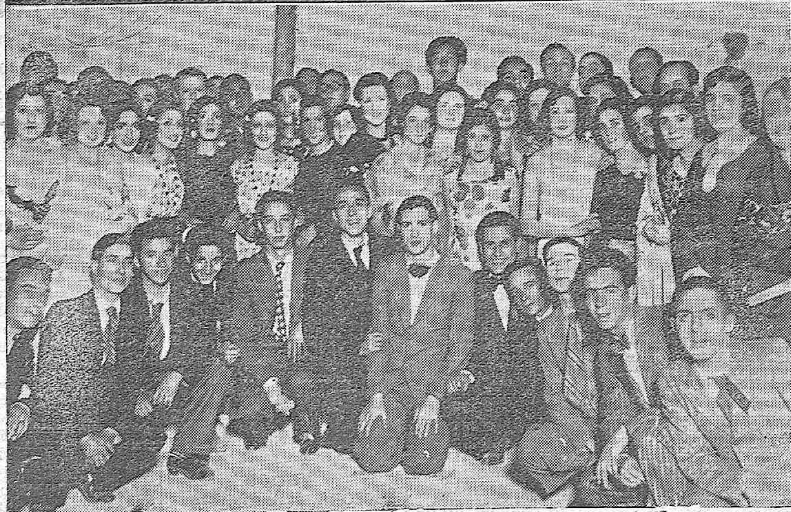
DOS VERBENAS.—Aspecto que ofrecía la caseta del Centro Republicano durante la animada verbena celebrada el domingo.—También en la caseta del Centro Filarmónico tuvo lugar una fiesta popular que se vió muy concurrida