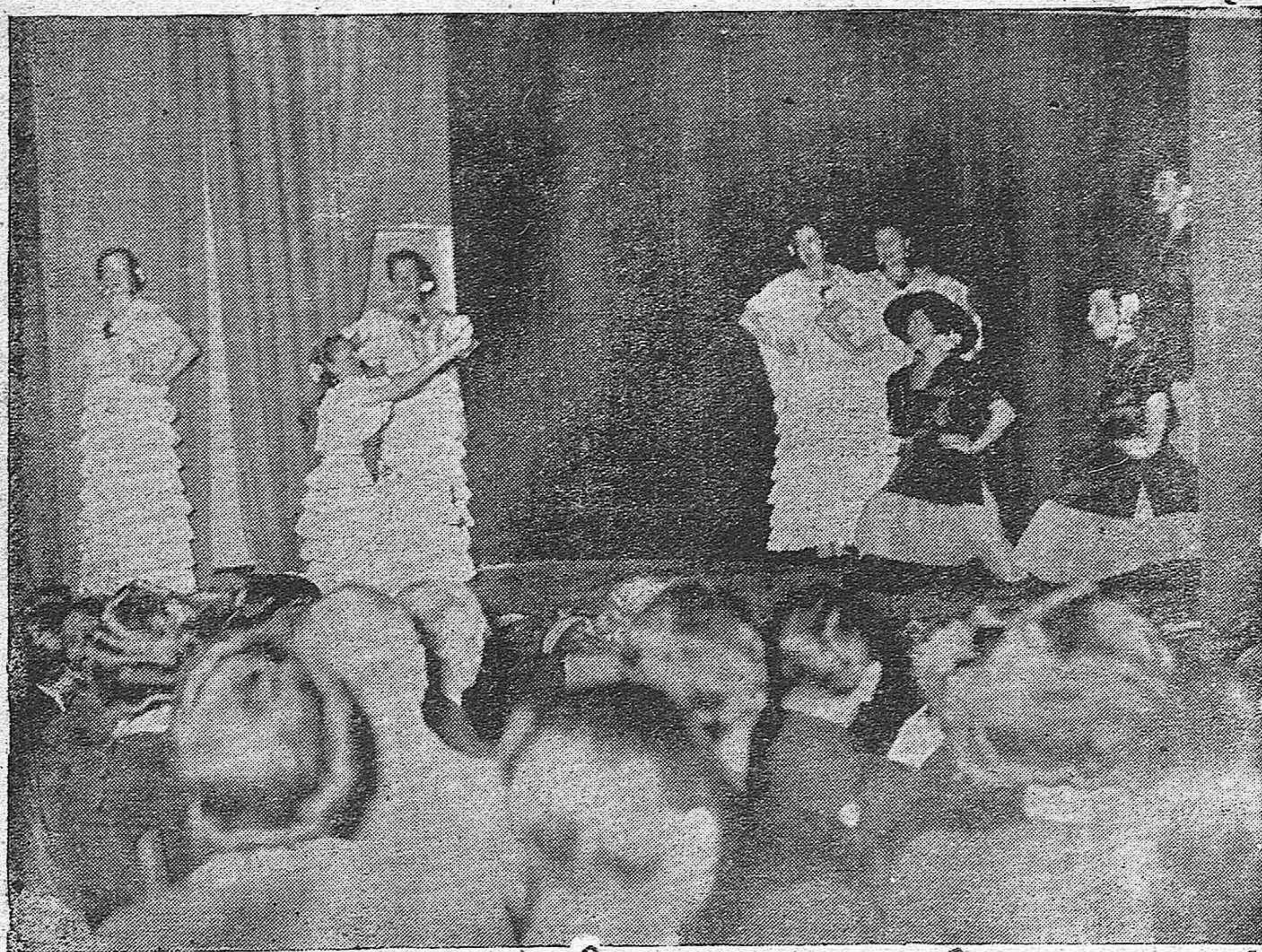
Bajo el protectorado del Embajador de España en Berlín, Excmo. Sr. Marqués de Magaz y del Ex Embajador Fupel se celebró en Berlín una función a beneficio de los soldados heridos de la España Nacional. La foto muestra un cuadro de "La Bandera".

En Berlín se celebró un festival a beneficio de nuestros heridos