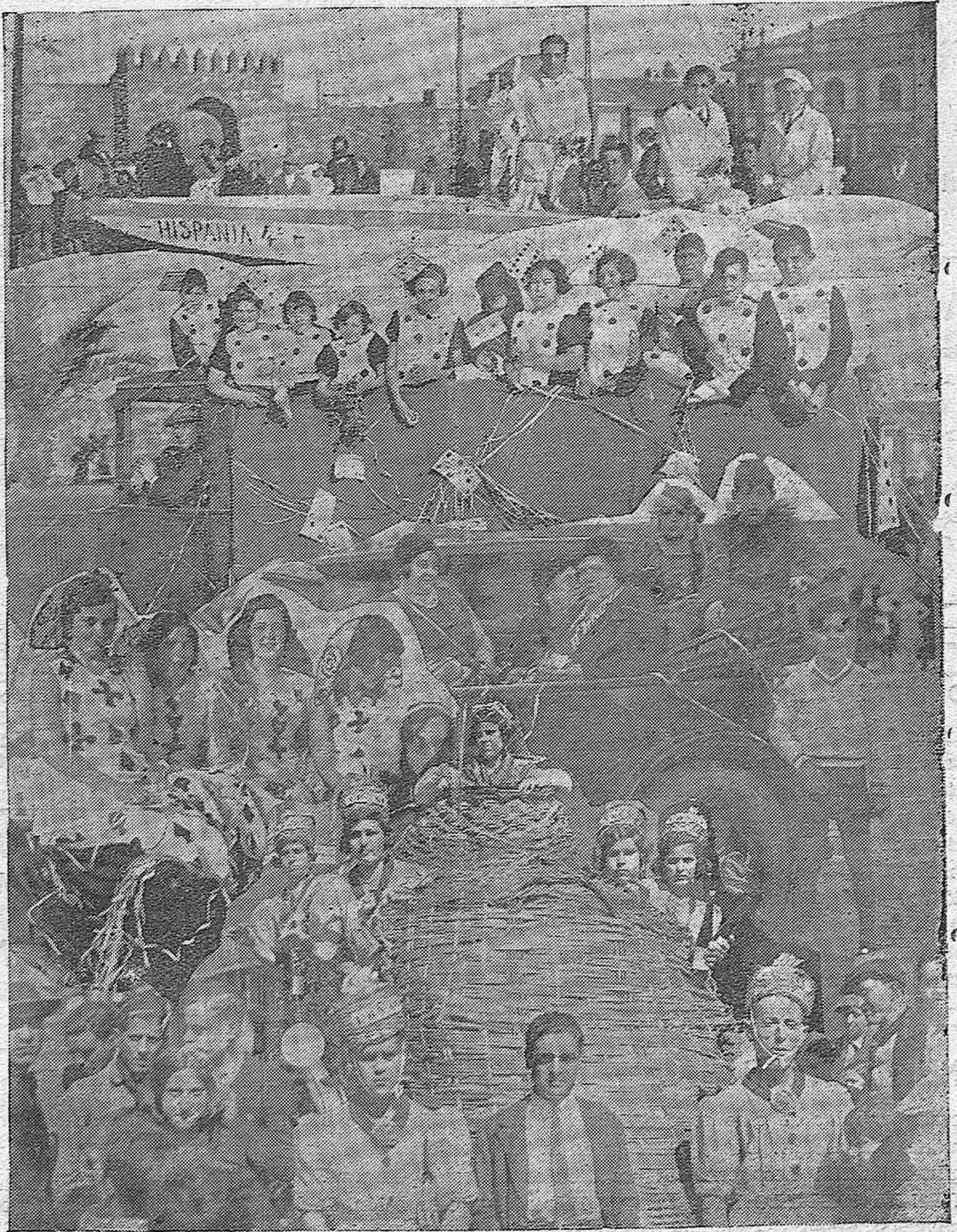
EPÍLOGO DEL CARNAVAL.—Vistasas carrozas que ocupadas por bellas señoritas tomaron parte en la batalla de flores del paseo de la Victoria