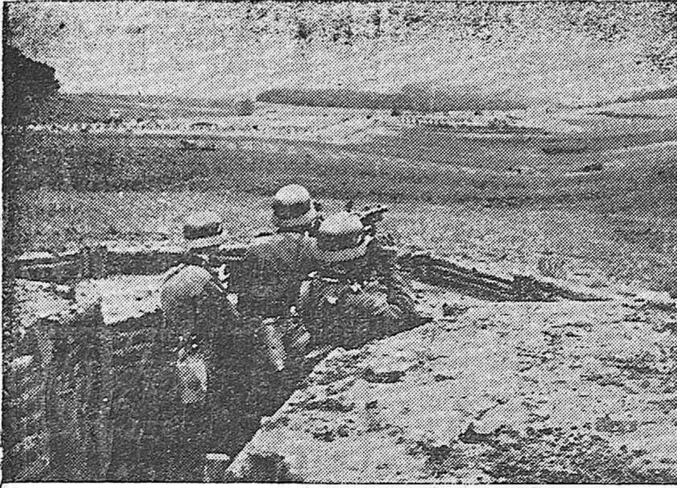
El cinturón de defensa en la frontera Oeste de Alemania. Un nido de ametralladoras.