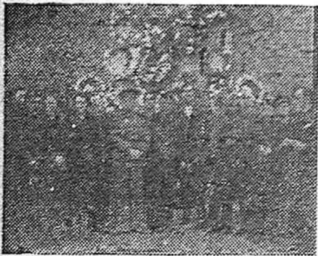
Las autoridades de Peñarroya-Pueblonuevo que presidieron los actos del II Aniversario del asesinato de José Antonio.

Luto en las banderas, luto en el cielo, luto en toda España. Crespones negros en las astas de las enseñas nacional y de la Falange; nubes grises que dejan caer lágrimas sobre los blancos crisantemos tejidos en coronas adornadas