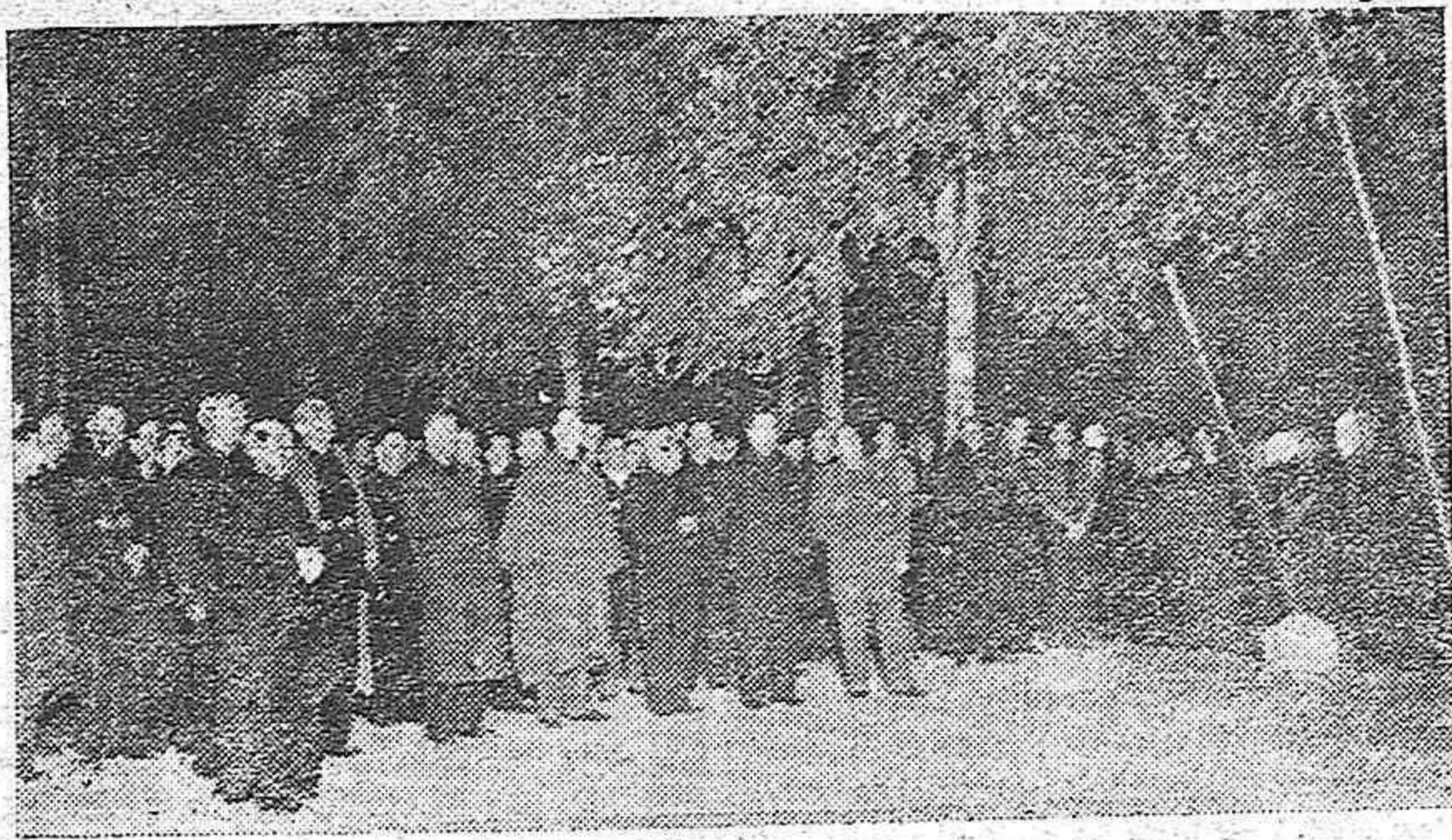
La Presidencia del Rosario de Oración y Penitencia en Córdoba, la madrugada del domingo 20 de Noviembre.