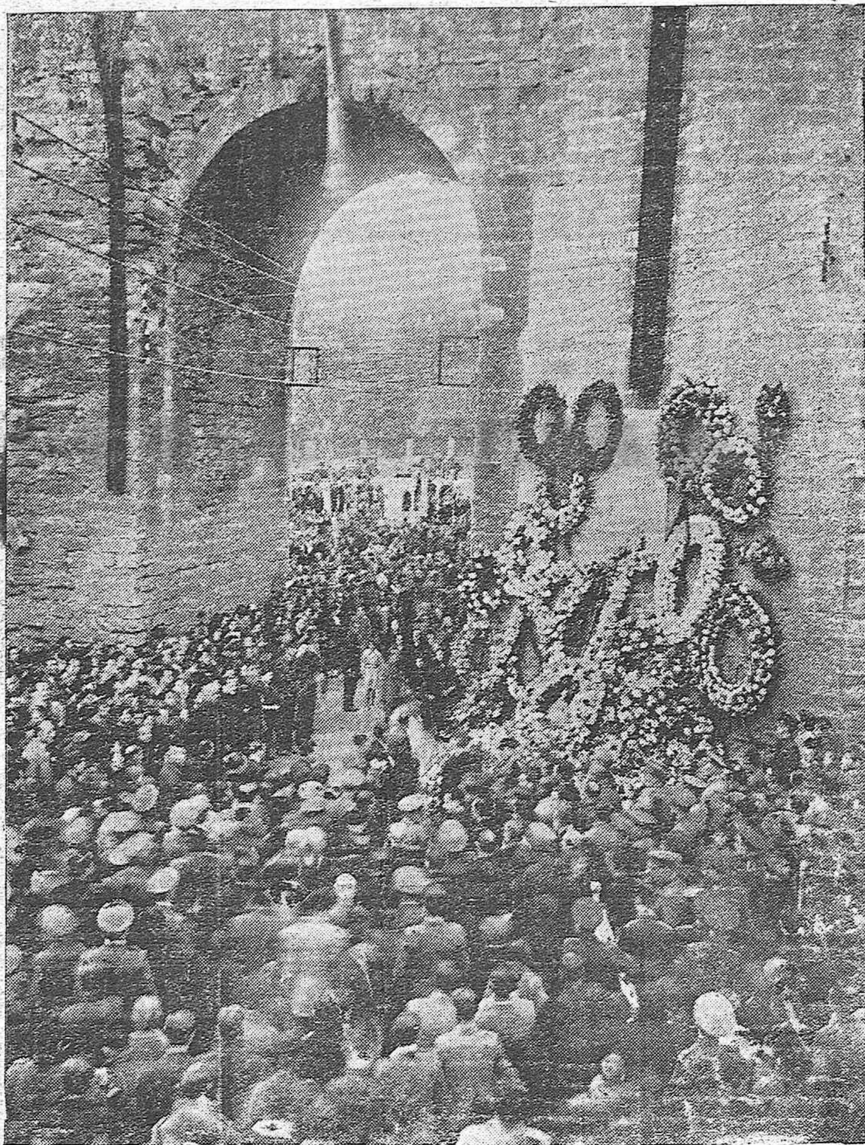
ANTE LA CRUZ DE LOS CAIDOS DE CORDOBA.-Aspecto que ofrecía el pie de la Cruz después de la colocación de las coronas y las flores, el lunes 21 de Noviembre.