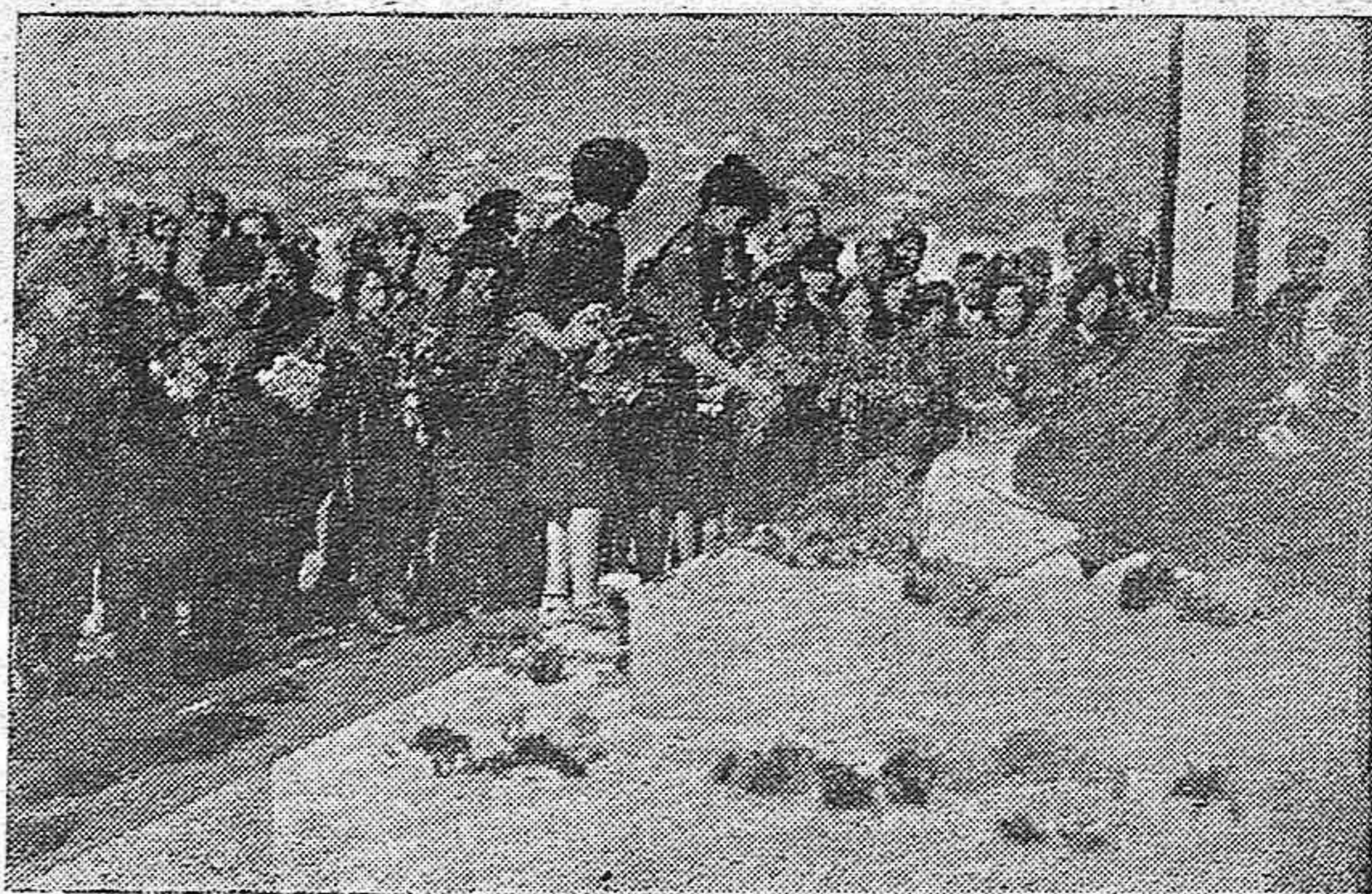
Las Flechas femeninas depositan flores al pie de la Cruz.