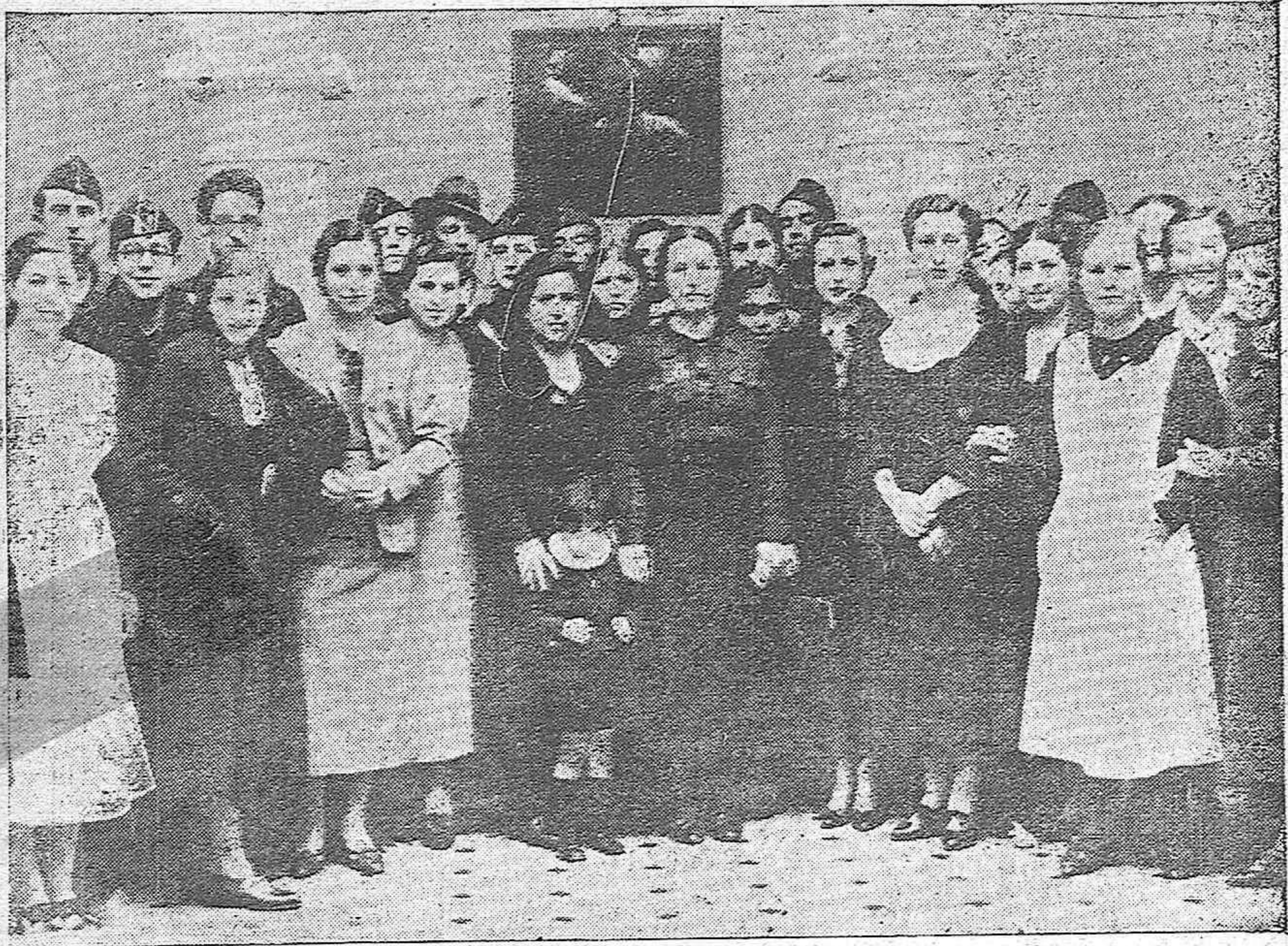
FALANGE EN FERNÁN NÚÑEZ.—La Sección Femenina de Falange Española de Fernán Núñez, que acaba de inaugurar el Comedor de "Auxilio de Invierno" en aquella localidad.