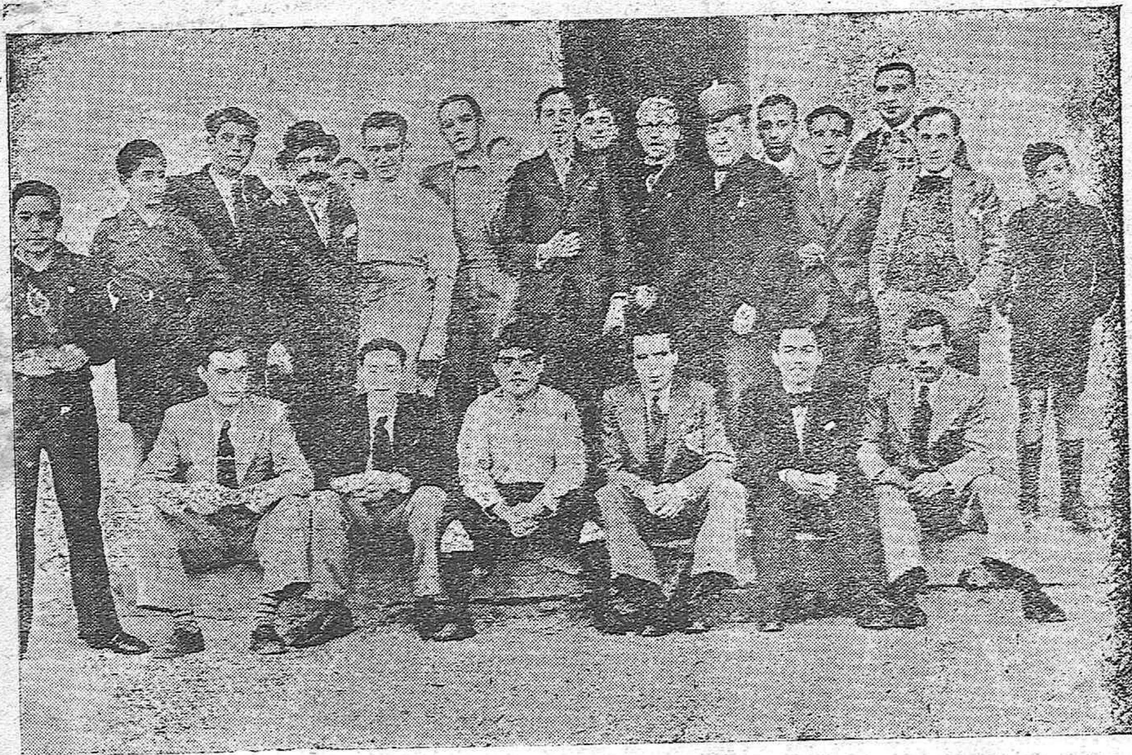
El Cuadro Artístico de la Asociación de Antiguos Alumnos de Don Bosco, después de celebrarse el festival en el Teatro de los Salesianos.