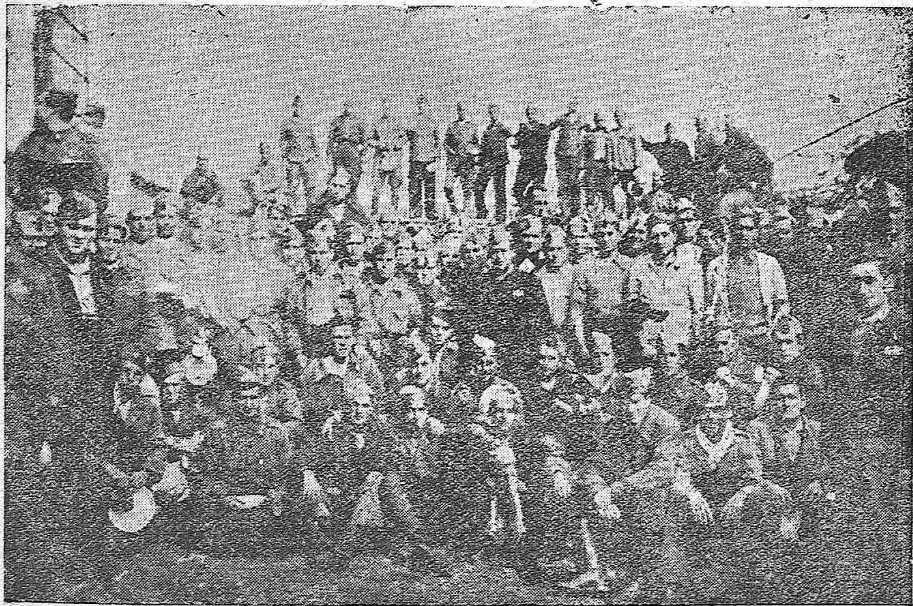
Un grupo de bravos artilleros fusileros que luchan en nuestros frentes contra el enemigo marxista vendido a Rusia.