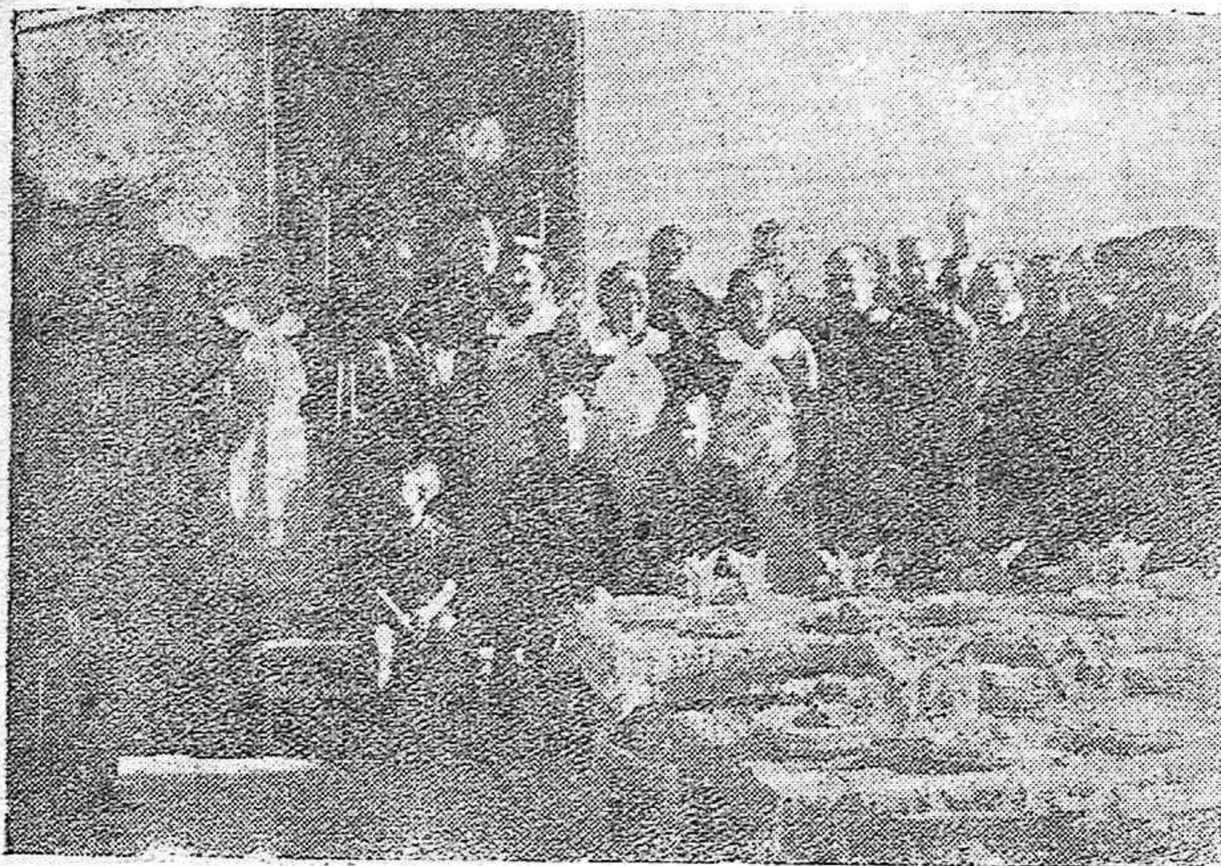
Acto de inaugurar el Comedor Escolar "Ramiro de Maeztu", donde las camaradas de la Sección Femenina, sirven la comida a los niños.