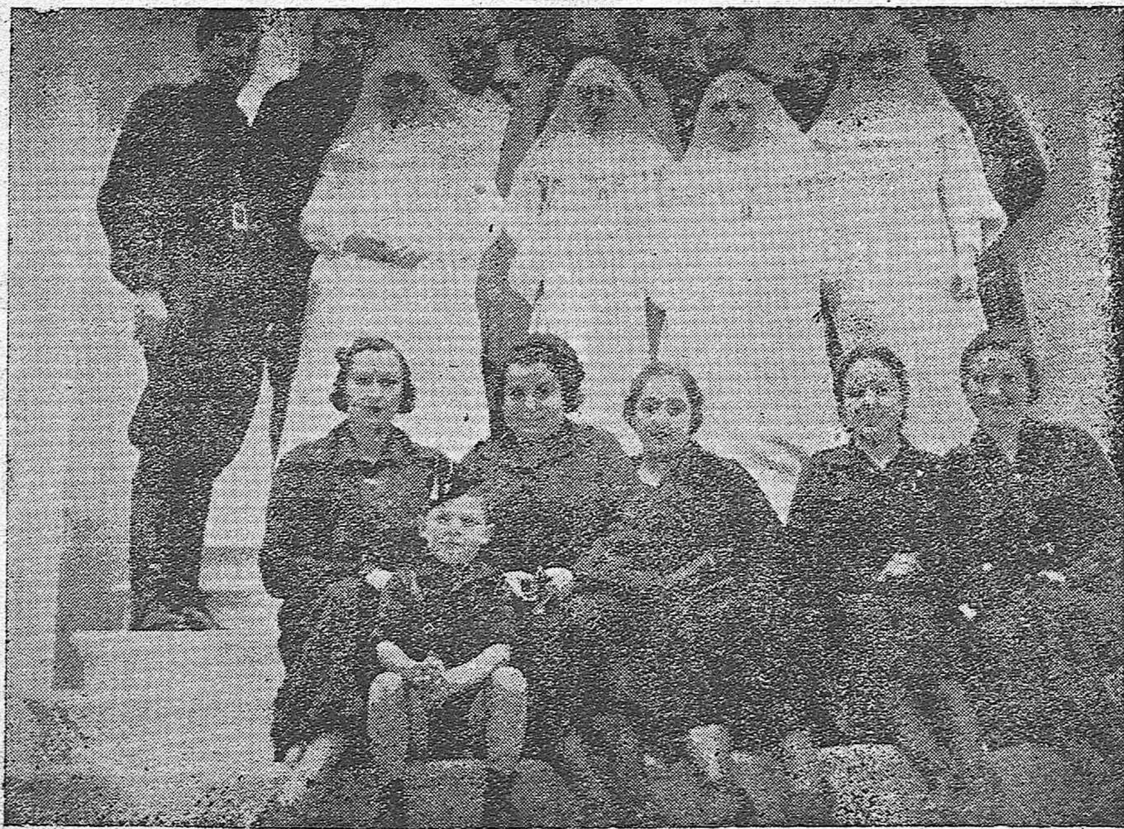
Las autoridades de Córdoba y Jefes de Falange, con la Sección femenina de F. E. de Puente Genil, visitan el Hospital de esta última población.