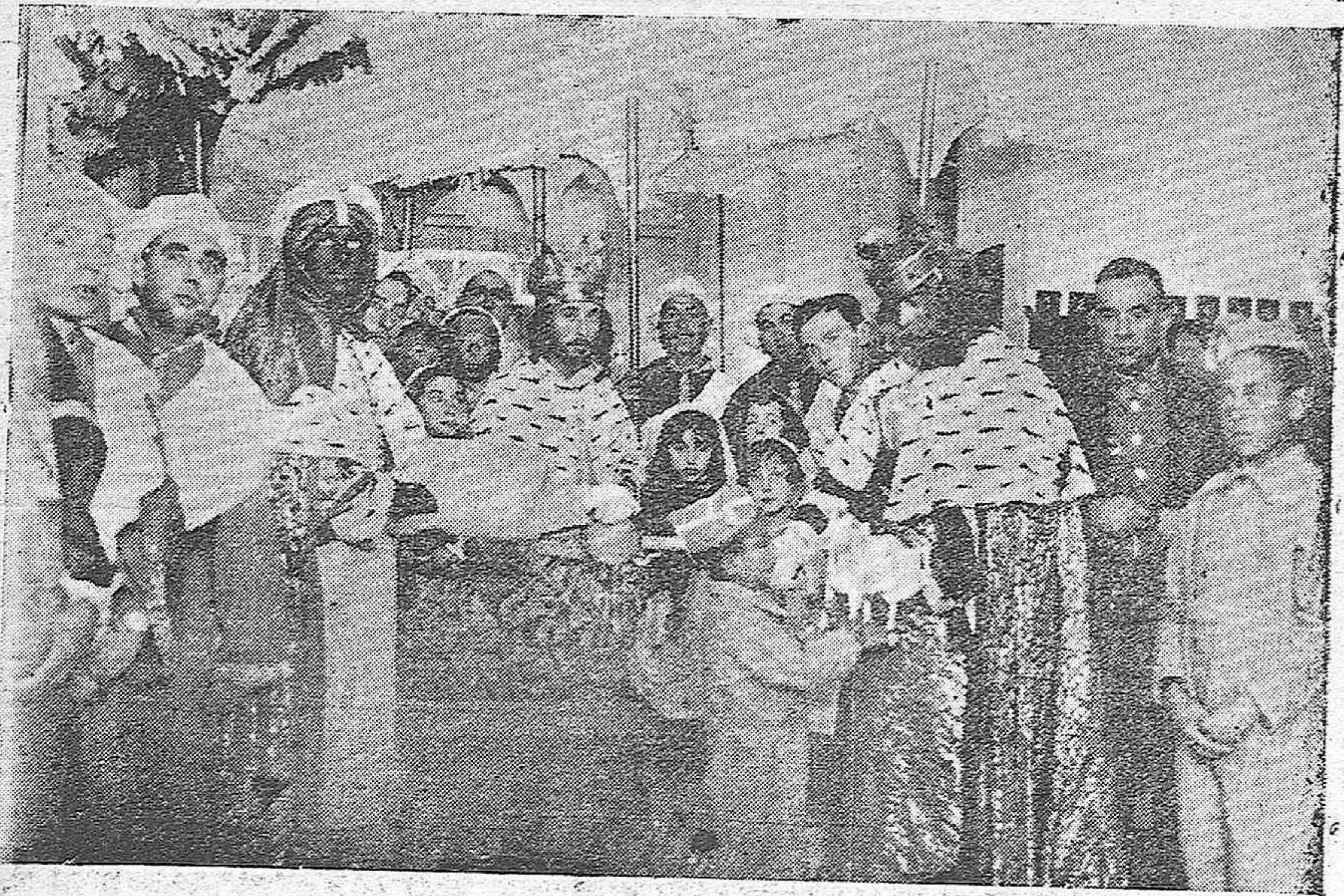
Los Reyes Magos, entregando juguetes a los niños lisiados en el Hogar y Clínica de San Rafael.