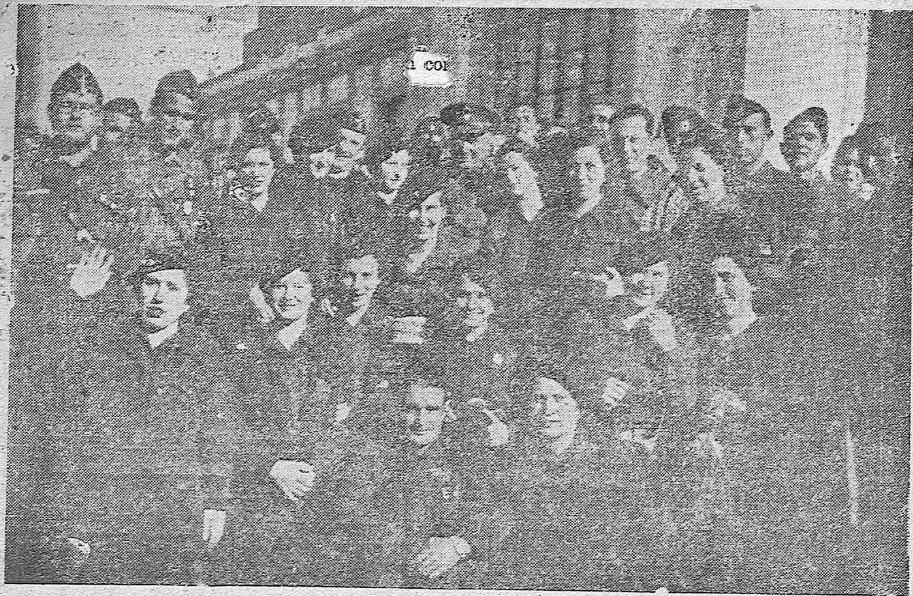
( Sección Femenina de Falange Española de Belmez. )