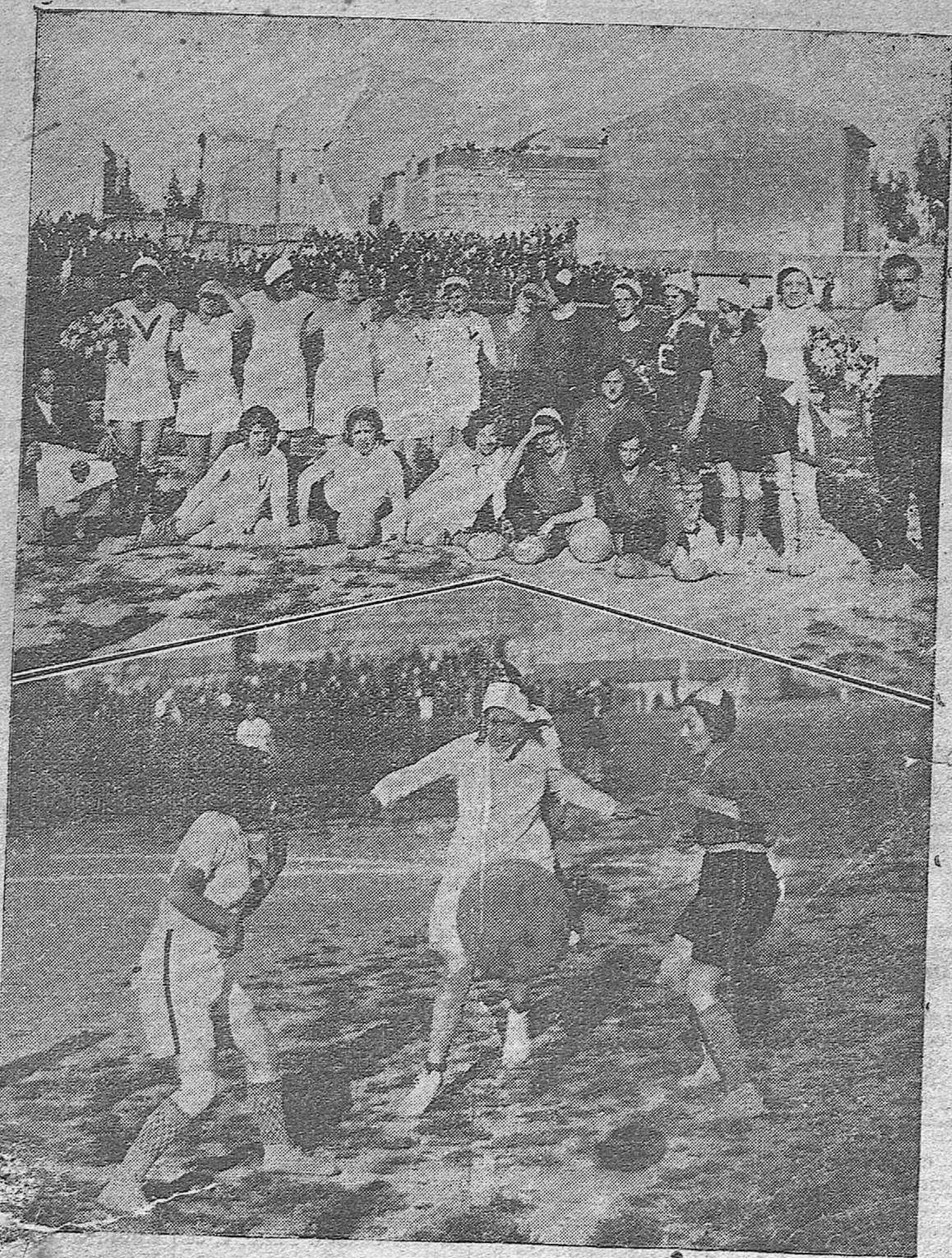
ARTIDO DE FUTBOL DE AYER.—Los equipos femeninos de balompié de Madrid y Valencia que tendieron en partido amistoso en el Stadium América.—Un momento de empuje de una medio velenciana, que en sus choots puso en grave apuro al fotógrafo.