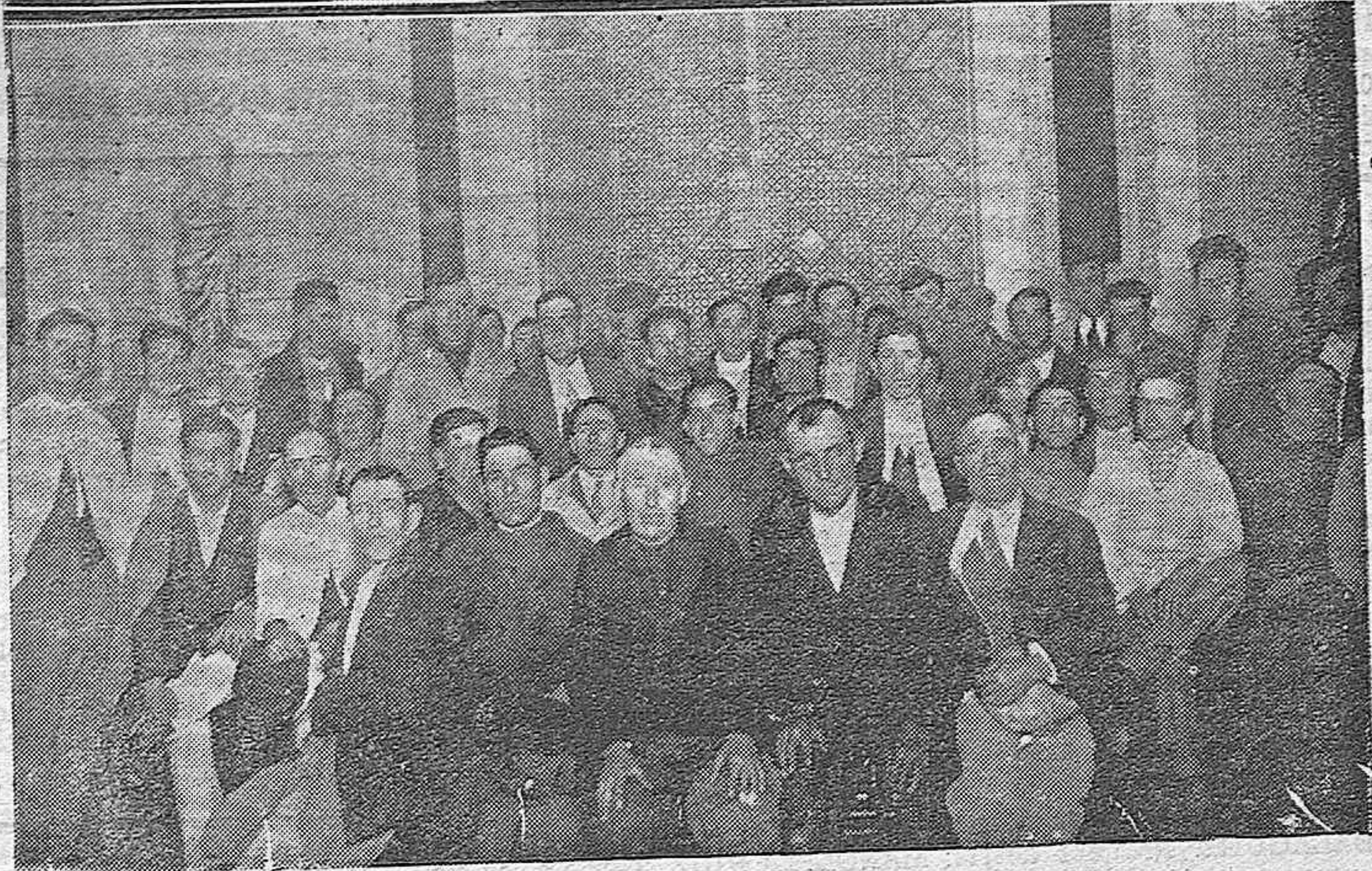
REUNION DE LA JUNTA CIUDADANA.—Presidencia del acto celebrado anoche en el Salón Capítular.— Una vista del público que asistió al mismo