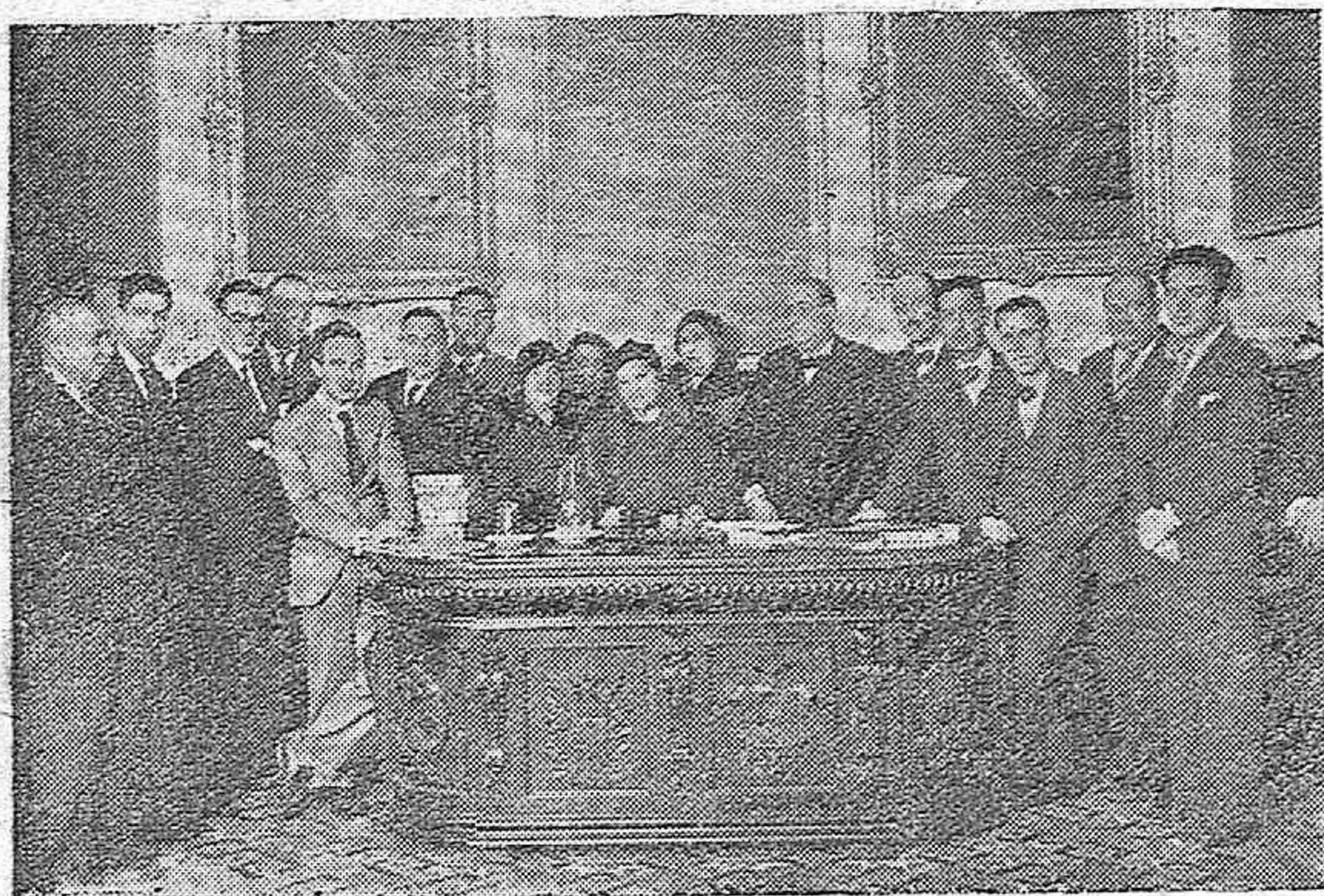
Los auxiliares de Enseñanza de los Centros docentes dependientes del Estado que se han reunido en Asamblea, en el Instituto de Segunda Enseñanza para tomar acuerdos en beneficio de la clase