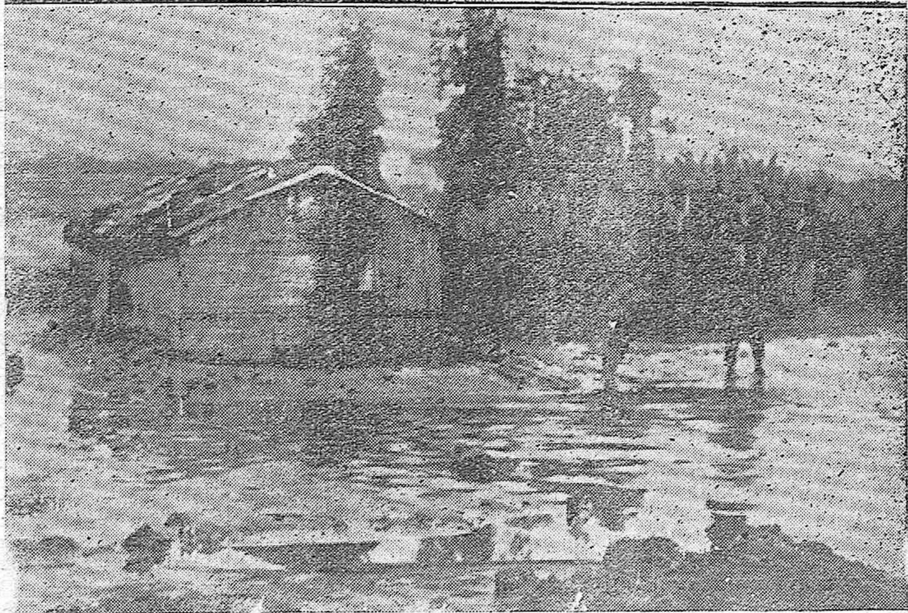
LOS EFECTOS DEL TEMPORAL.—El cuerpo de bomberos con sus jefes trabajando en el desagüe del Arroyo de las Piedras.—Uno de los chozos del barrio del Marrubial, aislado por las aguas