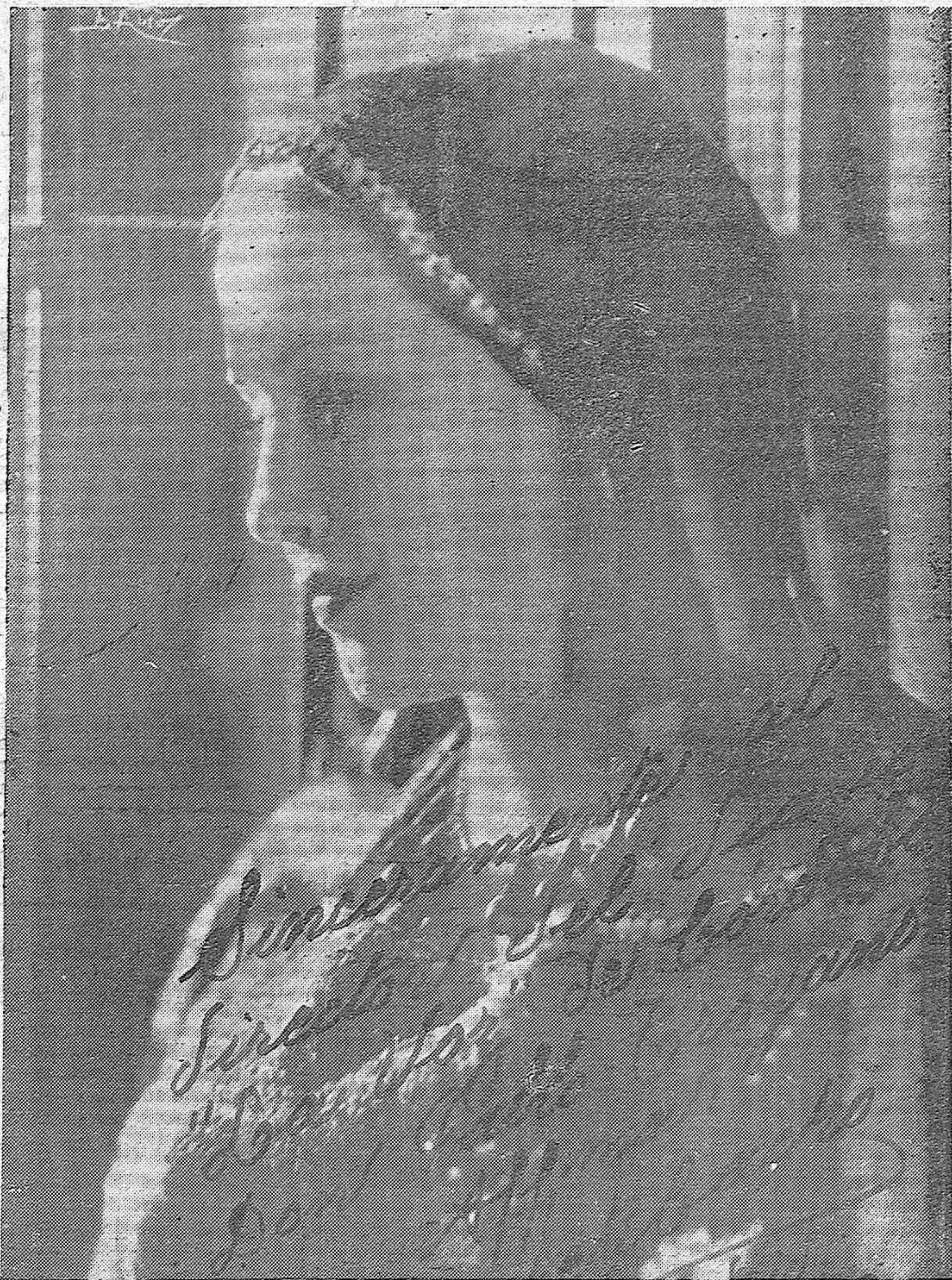
UNA EMBAJADORA DE ARTE.—La notable artista mejicana Lupe Rivas Cacho que al frente de sus huéspedes hará su presentación mañana miércoles en el teatro Duque de Rivas de esta capital