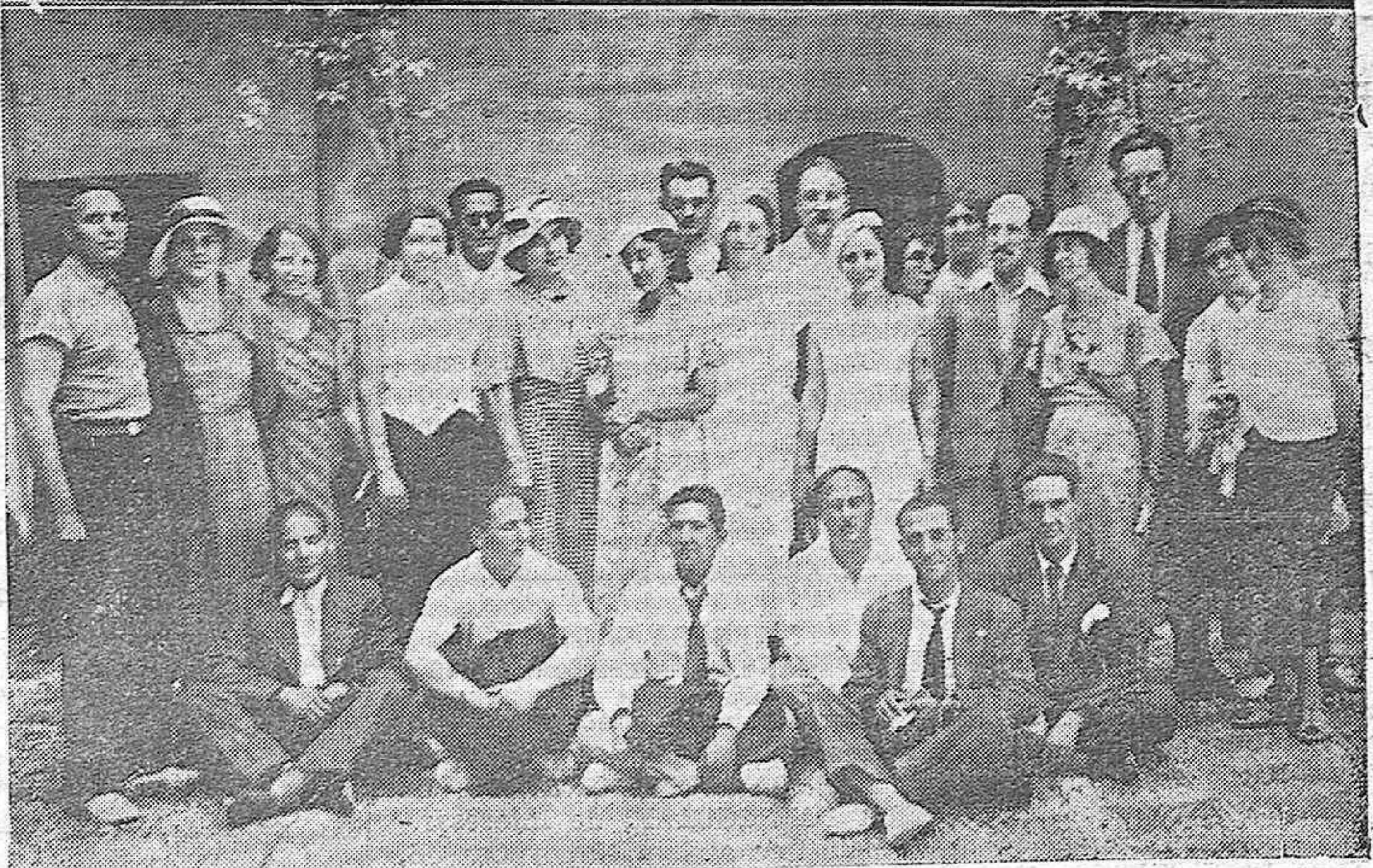
NOTAS GRAFICAS DE ACTUALIDAD.—Los miembros del Sindicato Nacional de maestros franceses que acaban de llegar en viaje de estudios visitan los lugares típicos y pittorescos cordobeses, acompañados de varios maestros.