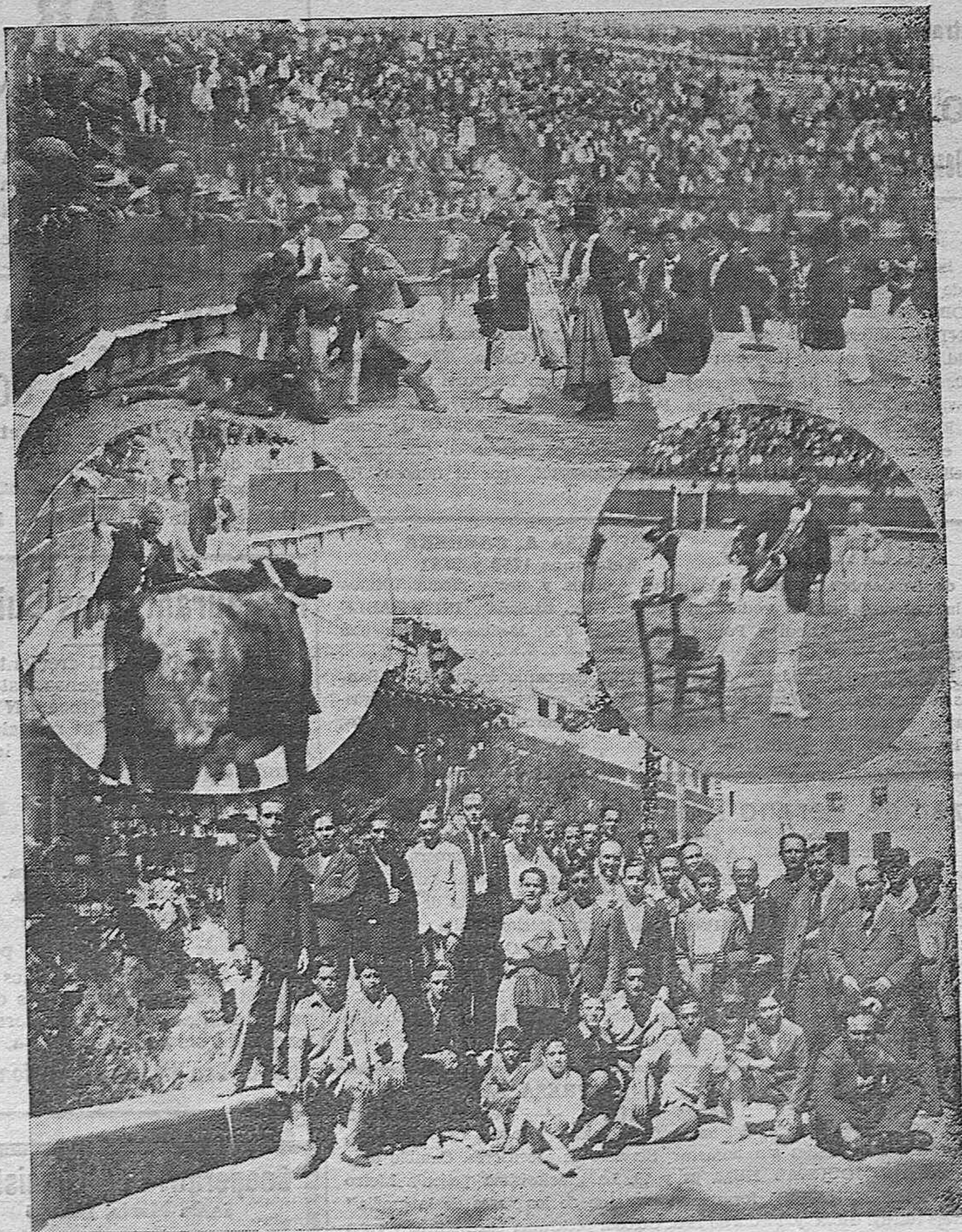
NOTAS GRÁFICAS DE ACTUALIDAD. — Varios momentos del festival celebrado en Friego por la Banda Infantil Los Califas. — Los excursionistas cordobeses en la renombrada fuente de la salud