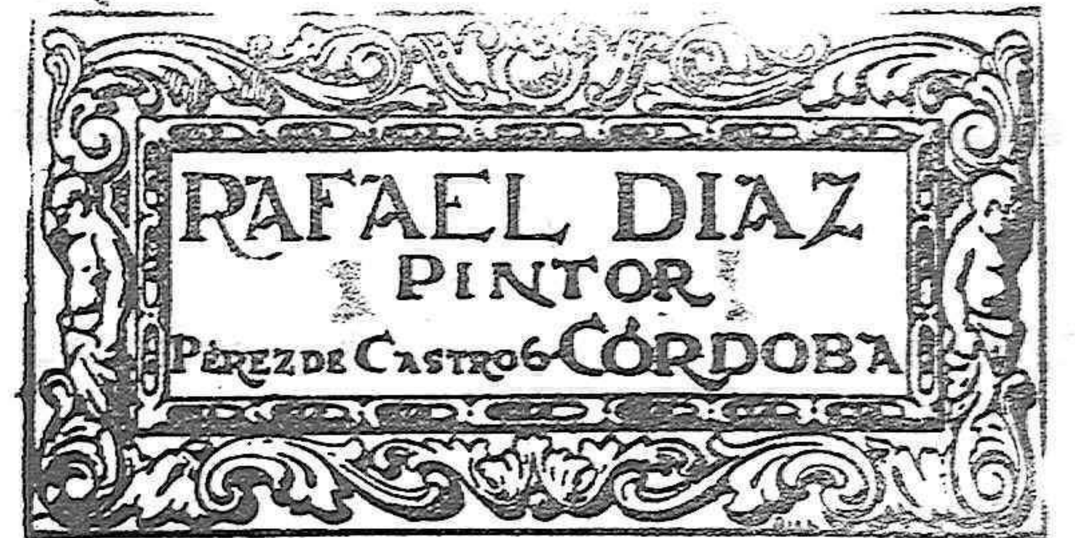
TALLA-DORADOS-RESTAURACIONES - PAPELES PINTADOS - Y - 122