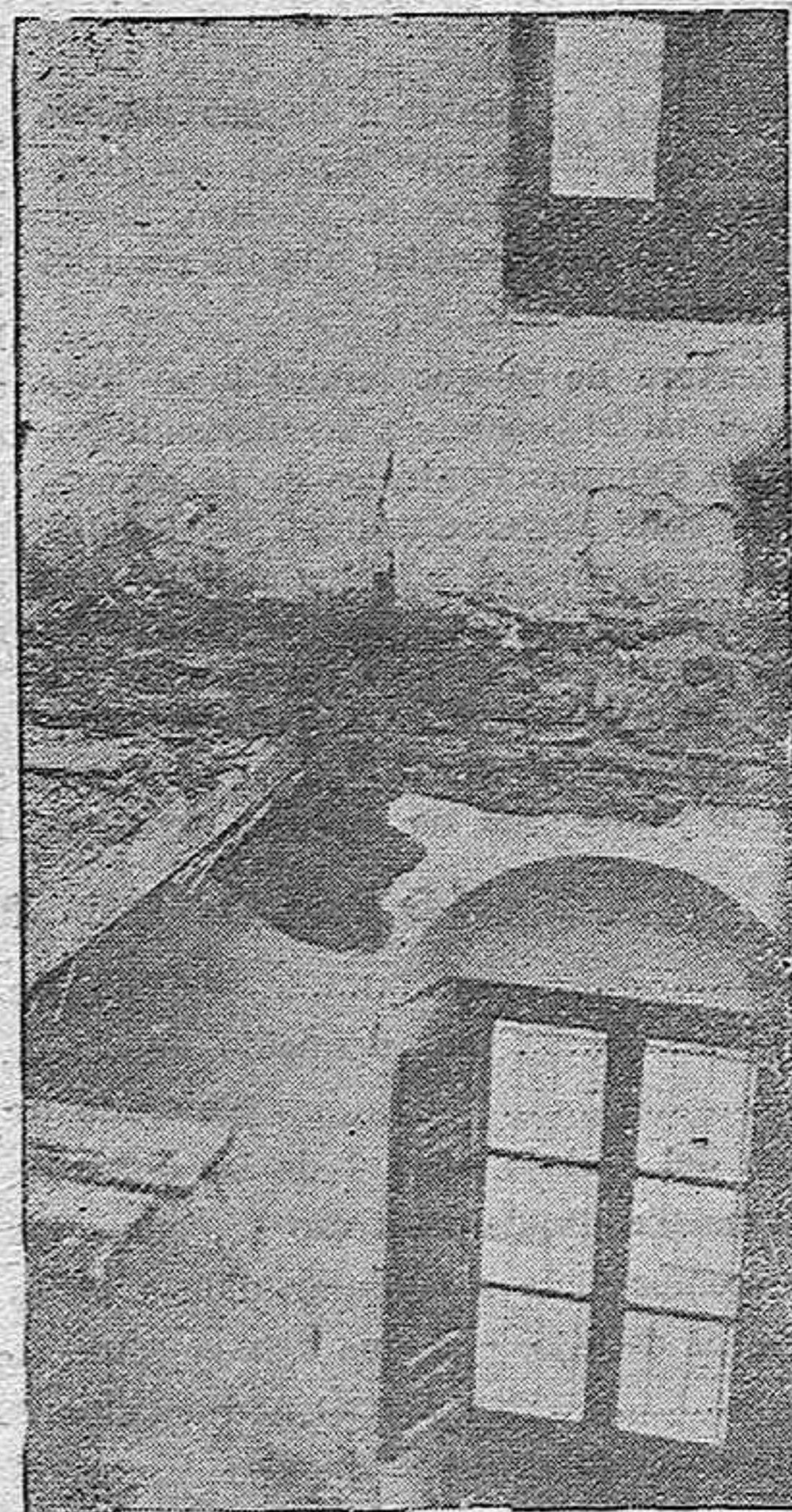
Hundimiento ocurrido a causa del temporal en una modesta vivienda de la carretera de la Fuensantilla, sin que hayan ocurrido desgracias personales.