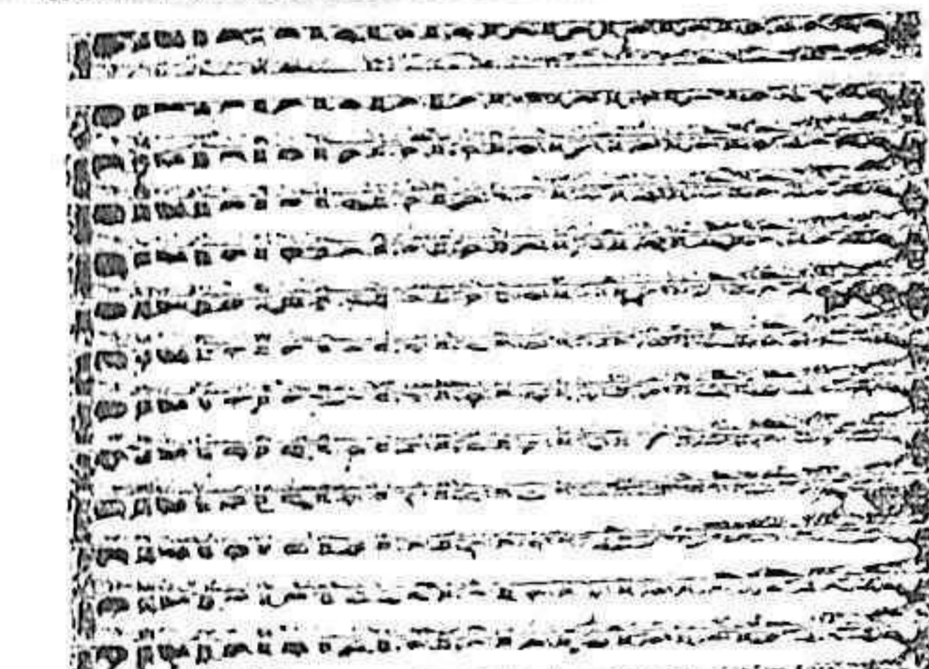
FIRMA DEL PRESIDENTE DE LA REPUBLICA