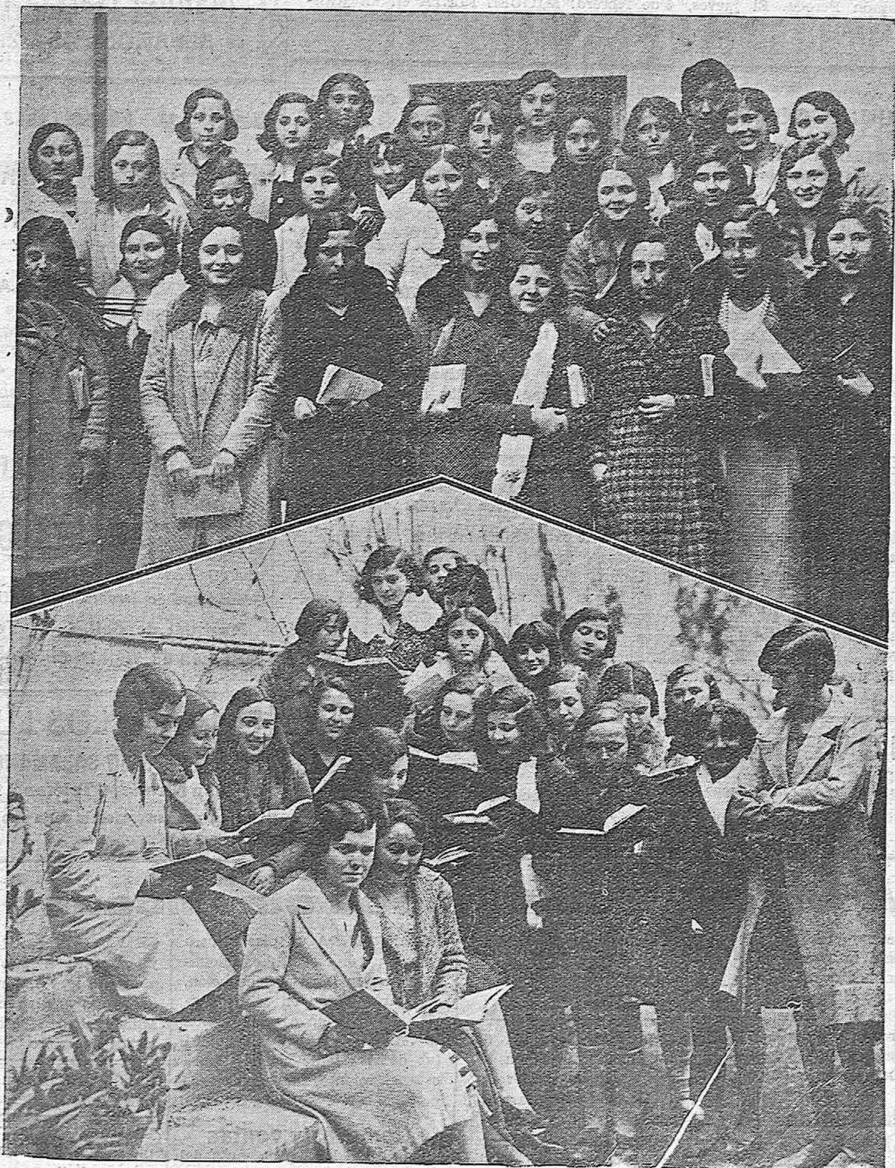
LA JUVENTUD ESTUDIOSA DEL PORVENIR.—Grupo de encantadoras estudiantes de Bachillerato, en un descanso entre las clases posan en el jardín del Instituto.—Las más aplicaditas aprovechan los momentos de ocio para el repaso de sus lecciones.