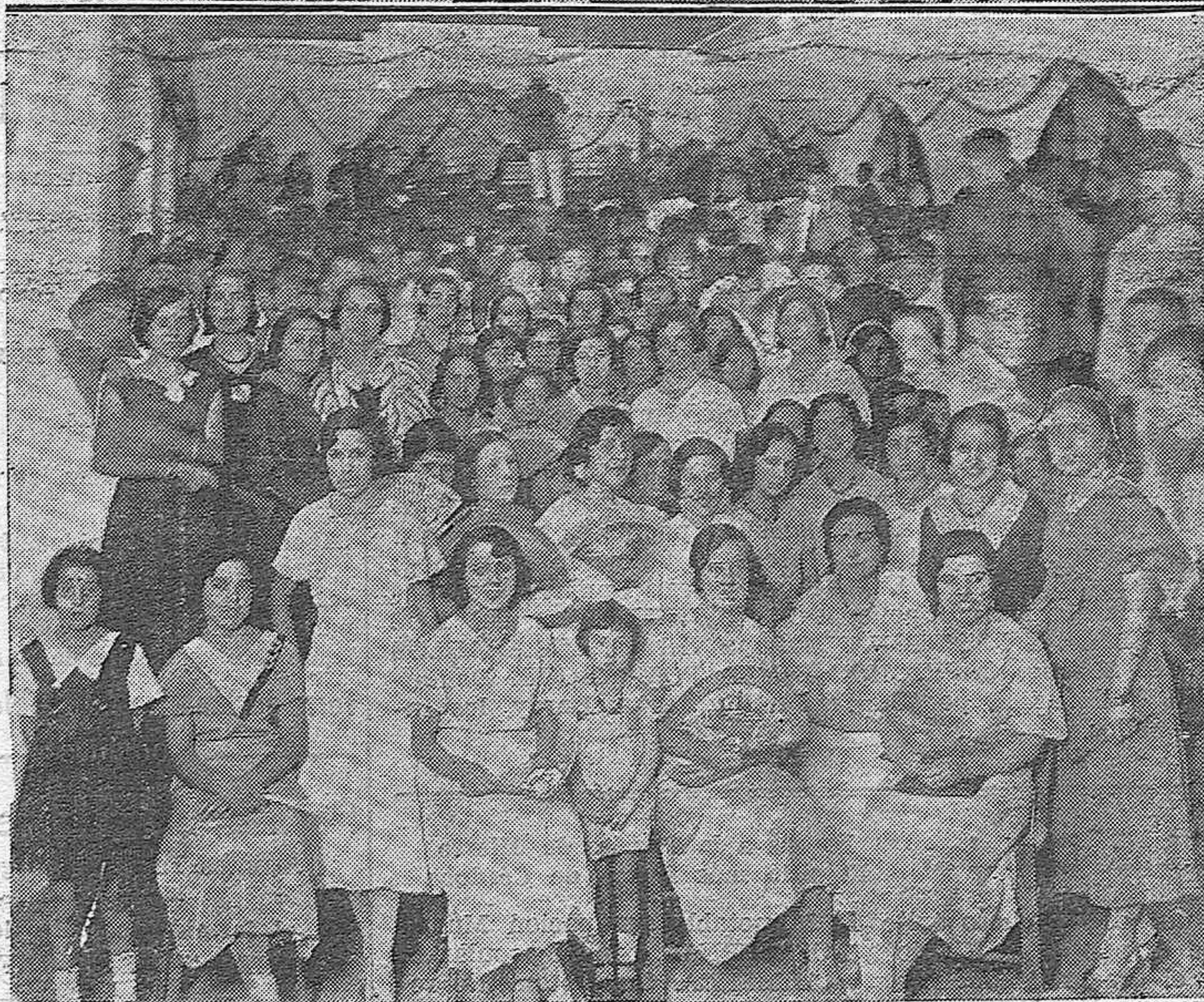
NOTAS GRAFICAS. —Con motivo de la feria en Villafranca la Banda municipal de la capital dió en mencionado pueblo un notable concierto a beneficio de las Cantinas Escolares.—Grupos de bellas señoritas de aquel pueblo que asistieron al festejo