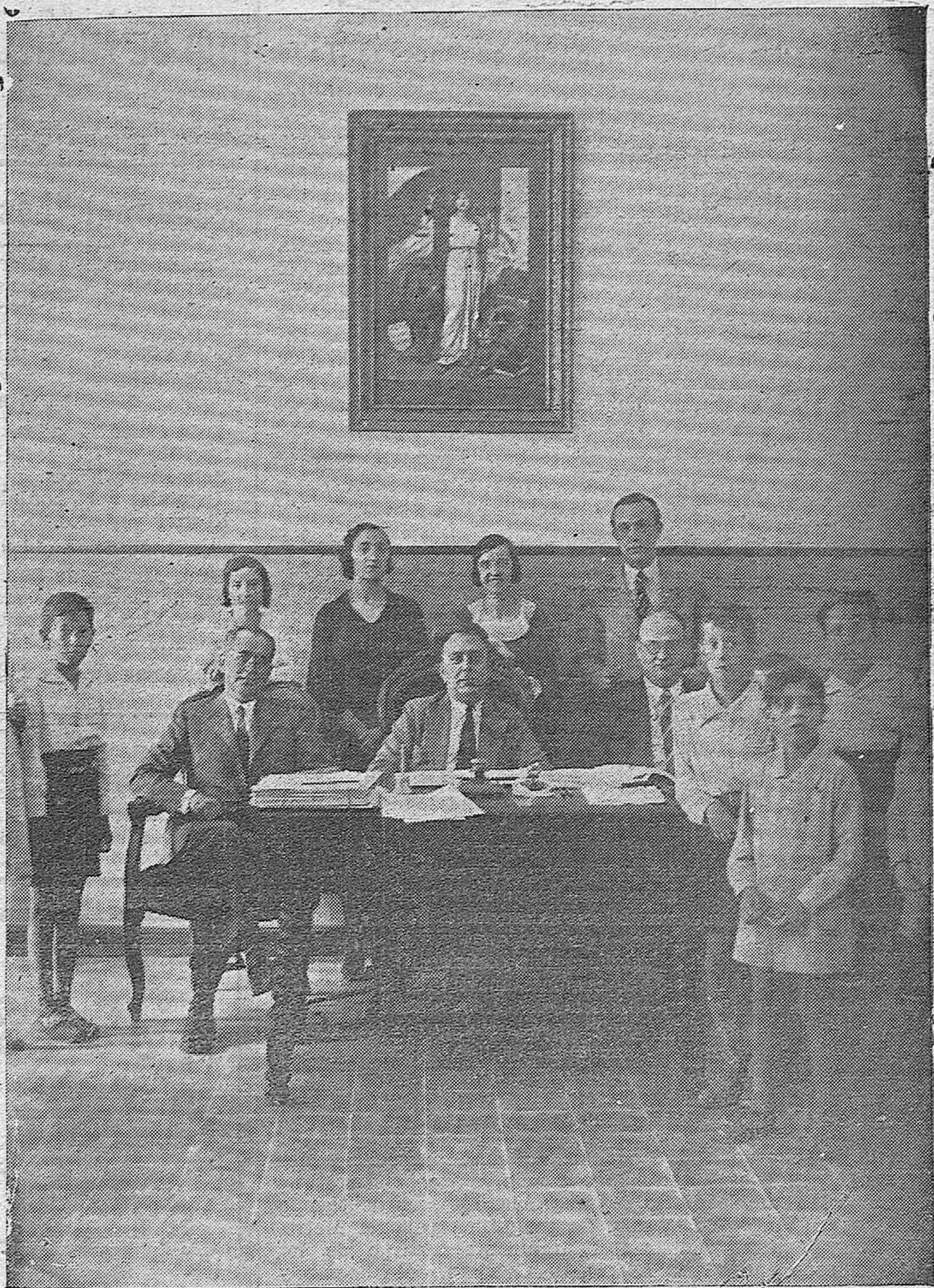
ACTUALIDAD GRAFICA. —En el Grupo escolar Colón se ha verificado esta mañana el reconocimiento de los niños que aspiran a formar parte de las Colonias marítimas.—He aquí a los pequeños con sus profesores y con los médicos encargados de declarar la aptitud