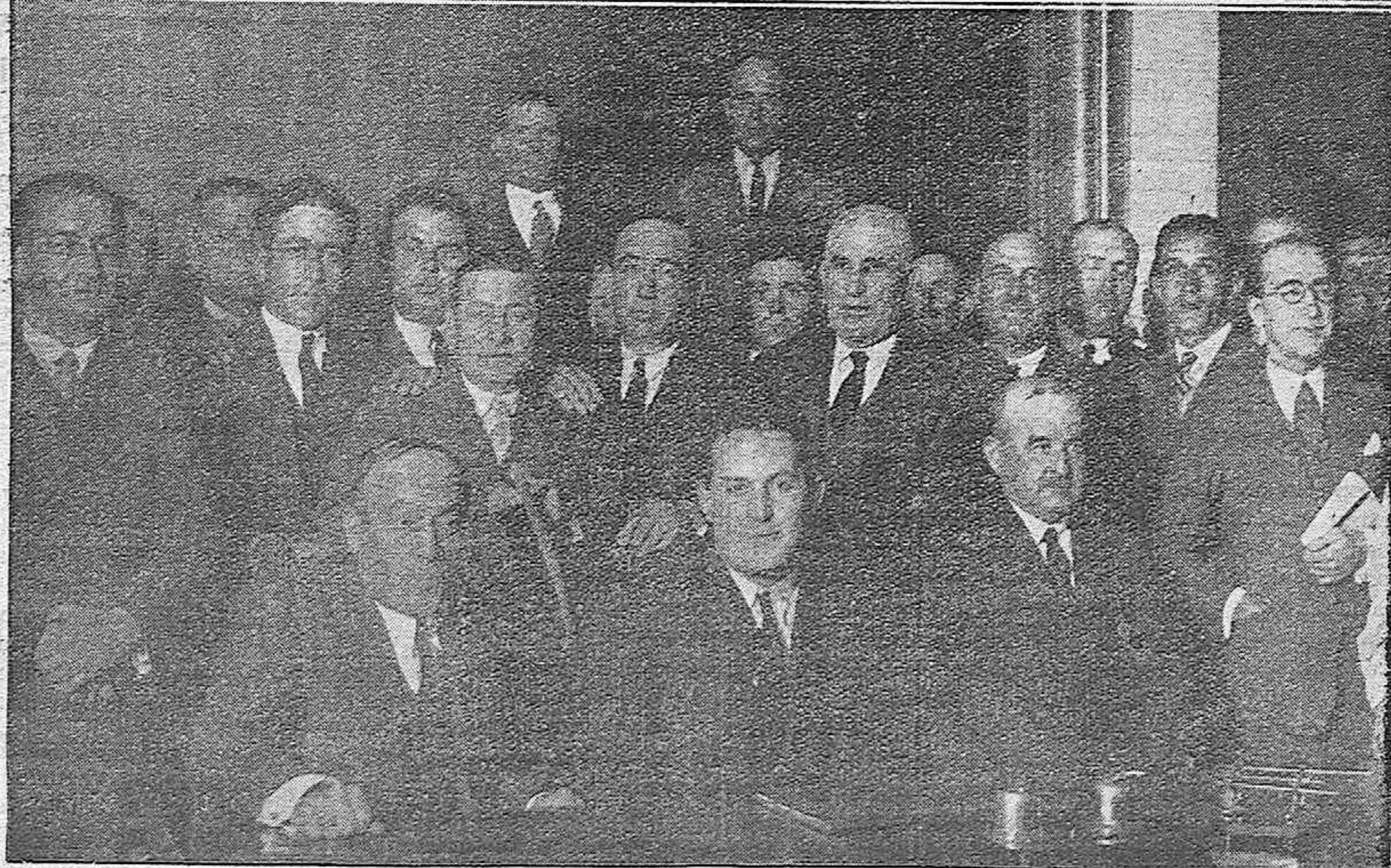
GRANADA.—Los asambleistas agrarios de Córdoba, en su visita a la Alhambra.—Presidencia de la Asamblea de Arrendatarios-Agricultores celebrada con carácter regional en el salón capitular del Ayuntamiento.