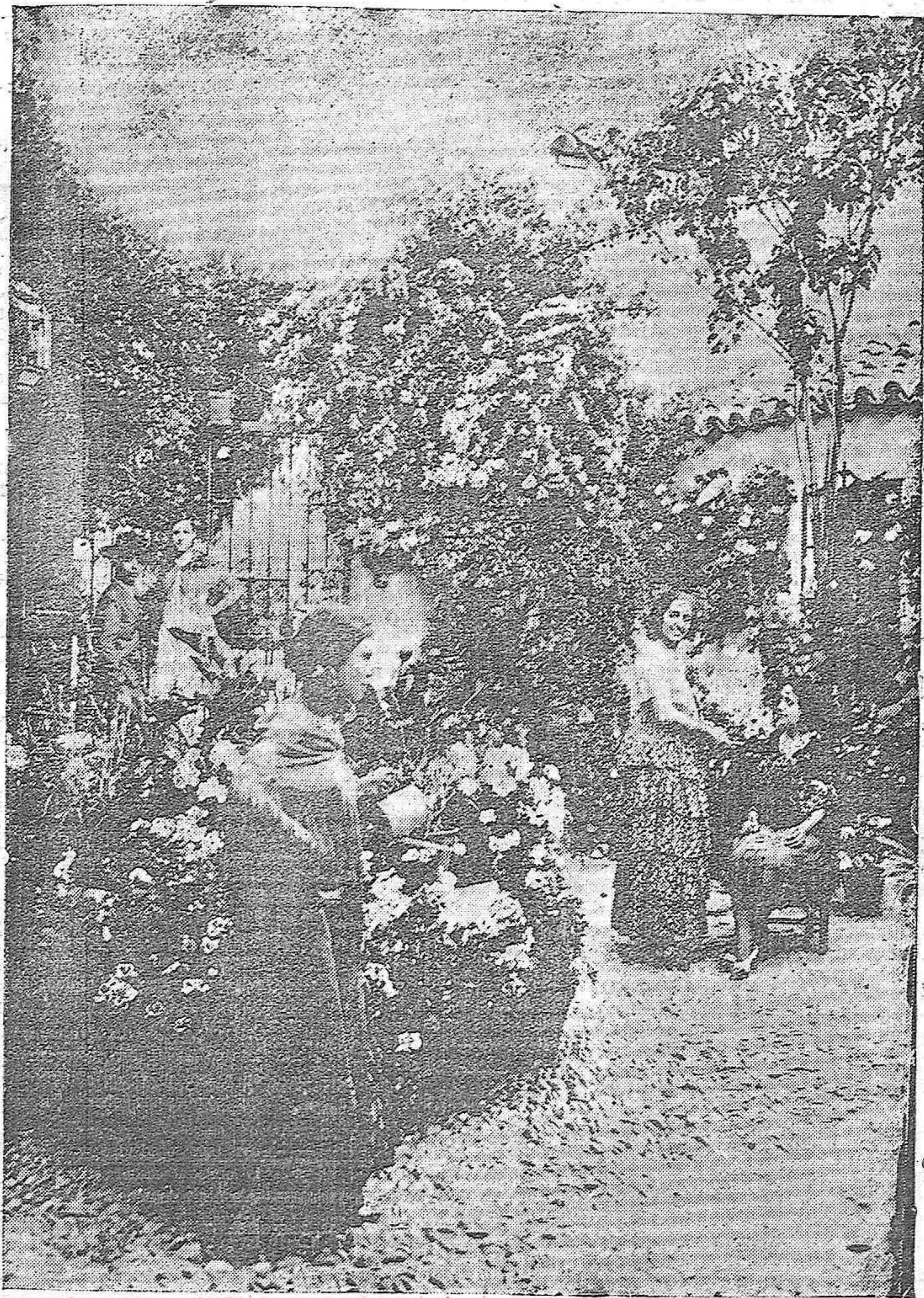
EL CONCURSO DE PATIOS.—He aquí el patio de la calle Gutiérrez de los Ríos, al que se le ha adjudicado el primer premio. El fallo ha sido considerado justo unánimemente.