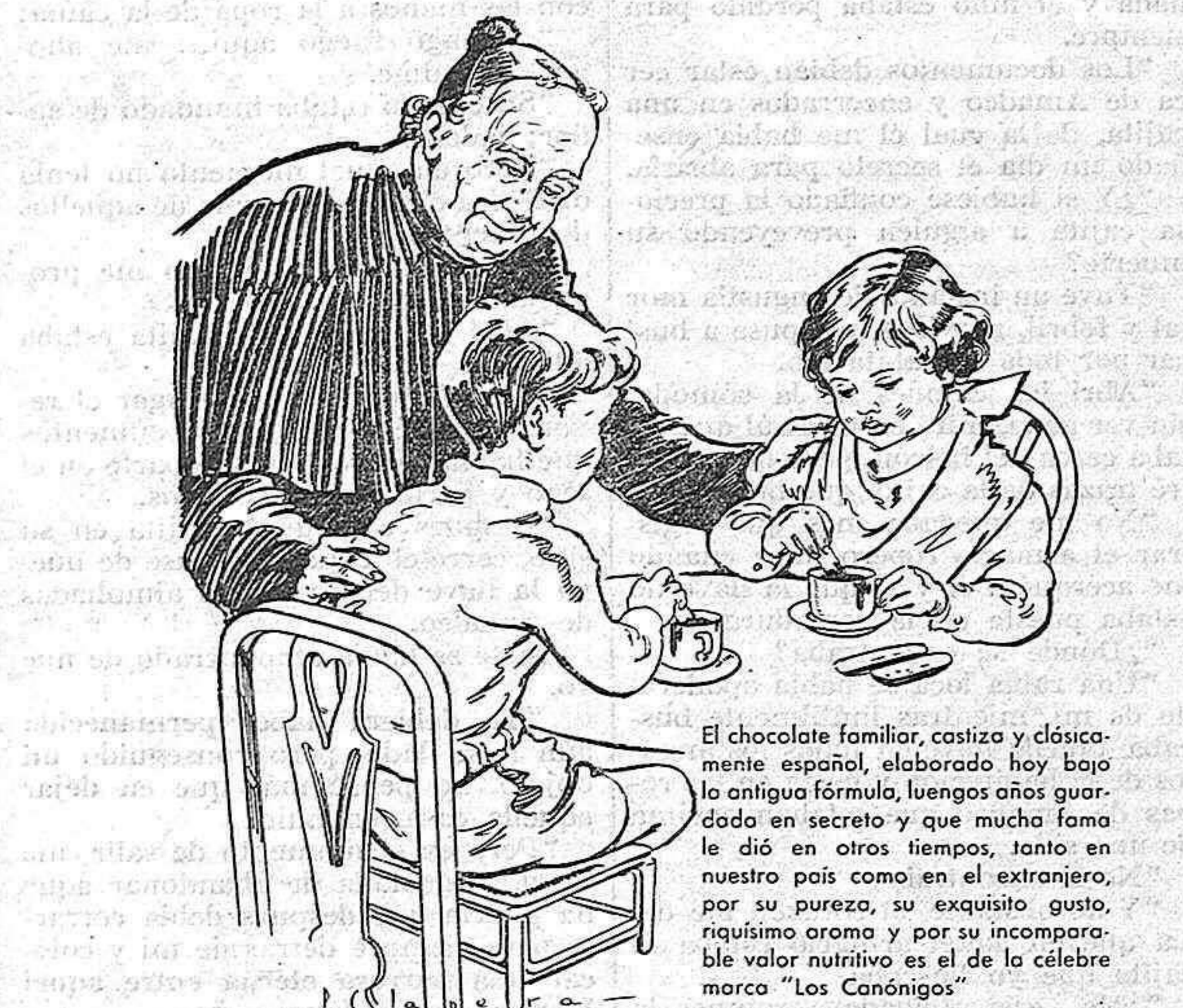
"Una jicara de chocolate "Los Canónigos" es obra de las delicias de España."

NUEVO RESTAURANT "LOS LUISES" Cubiertos a tres pesetas - tres platos, postre y vino. Morería, 14 Teléfono 2613