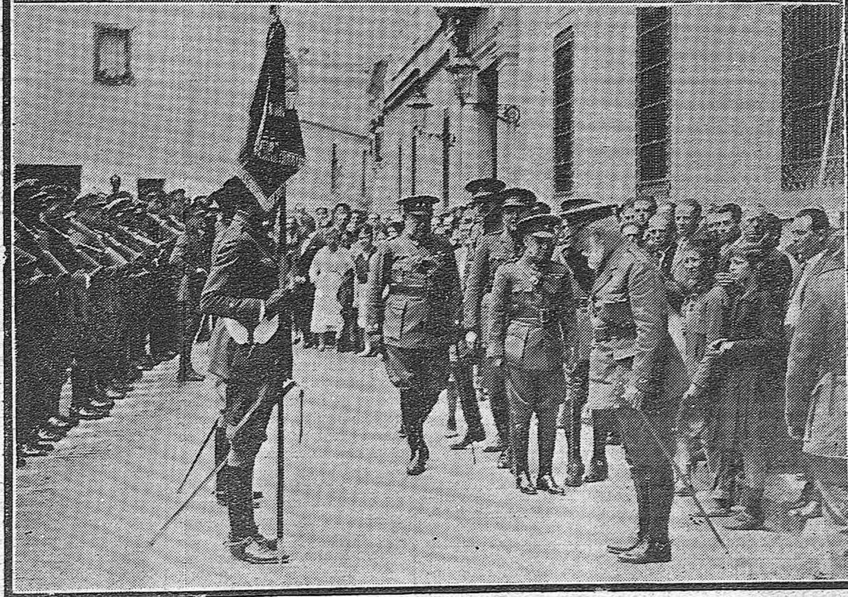
MADRID.—Toma de posesión y constitución del nuevo Consejo de Estado. Don Niceto Alcalá Zamora con todos sus compañeros de Gobierno, dando posesión al presidente y a los nuevos consejeros de Estado.