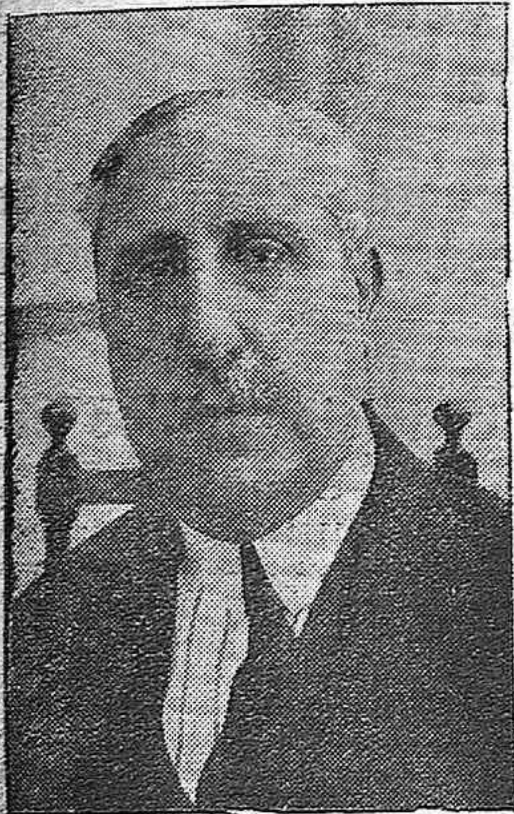
EL DUQUE DE MAURA, MINISTRO DE TRABAJO

En el prestigio de su apellido y en la consecuente colaboración con su ilustre padre, lleva el duque de Maura el aval de su labor futura. Su gran capacidad política estará en todo momento al servicio de la Patria. Perteneció a la Asamblea Consultiva.