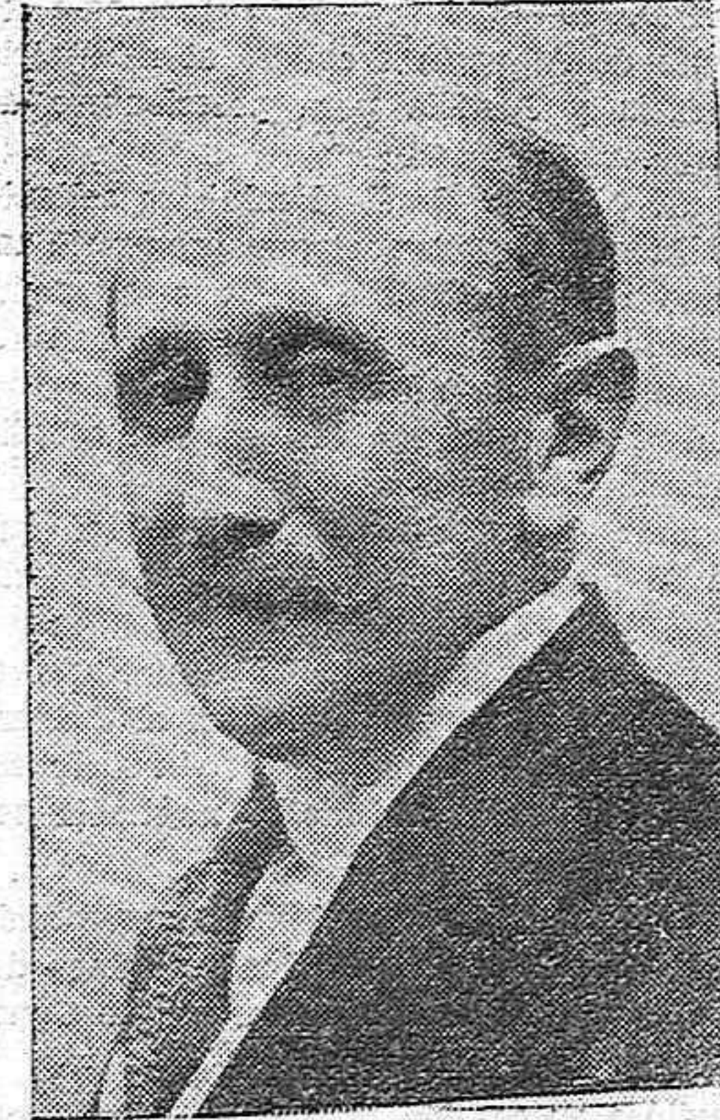
EL MARQUES DE HOYOS, MINISTRO DE GOBERNACION