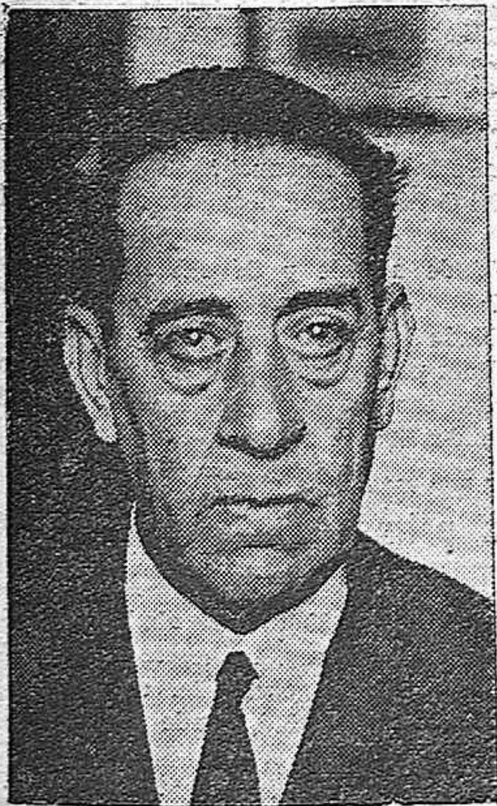
EL ALMIRANTE RIVERA, MINISTRO DE MARINA

En los Consejos de la Corona es harto conocido este político murciano. No hemos de recordar su entereza e inflexibilidad patriótica en mil problemas nacionales y en diferentes etapas de la política española. Perteneció a la Asamblea Consultiva.