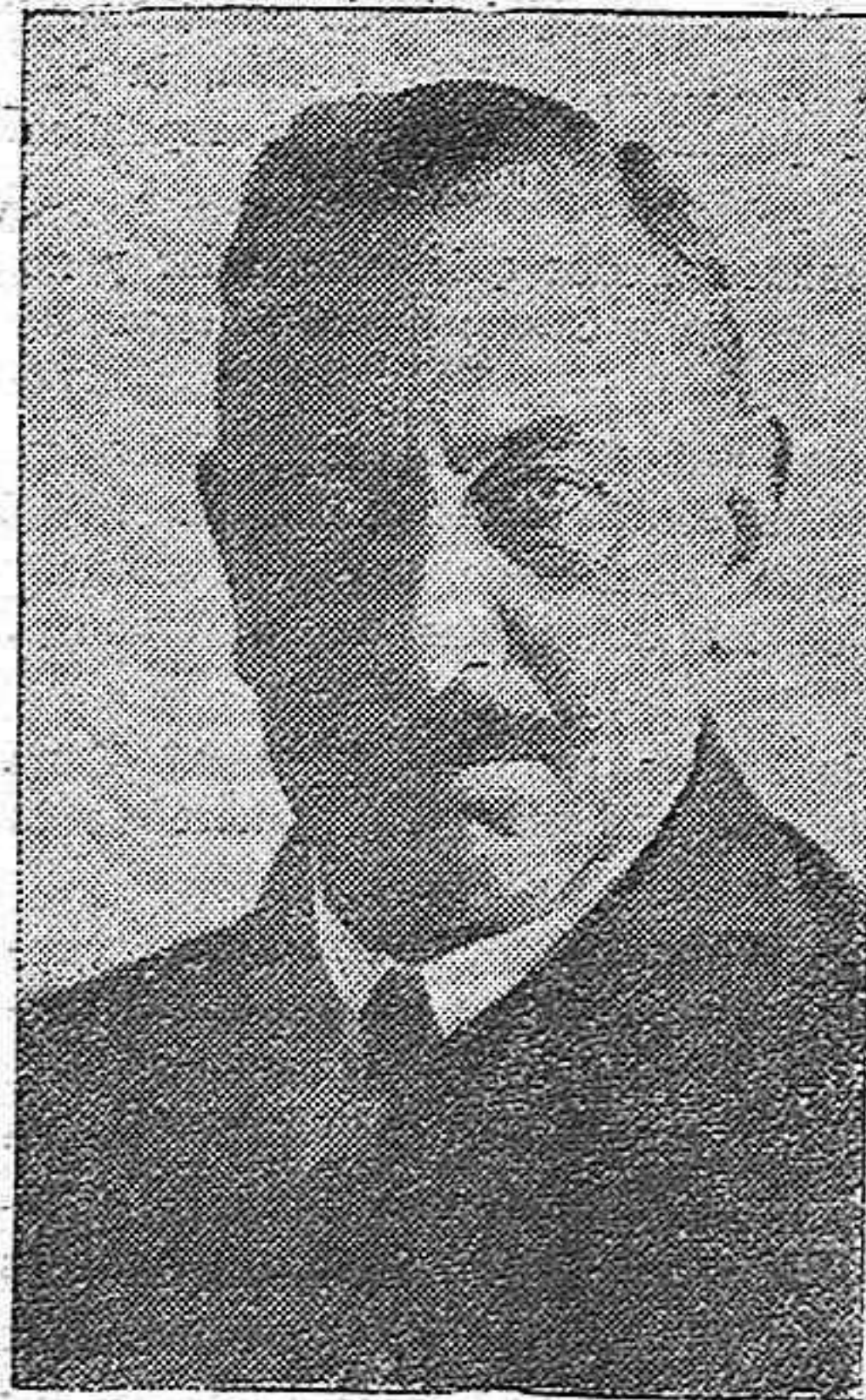
MARQUES DE ALHUCEMAS, MINISTRO DE GRACIA Y JUSTICIA

Bizarro marino, hecho en las guerras coloniales y en África. Fue Ministro de Marina en el último Gabinete presidido por García Prieto. Posee el Toisón de Oro. Su nombramiento para la presidencia del Consejo ha sido muy bien recibido.