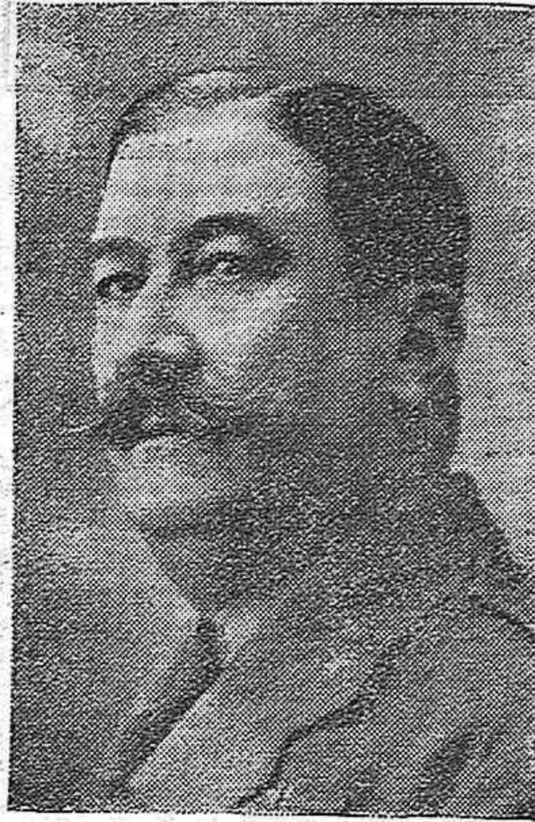
EL GENERAL BERENGUER, MINISTRO DE LA GUERRA

El cronista limita hoy su labor a servir esta nota de la máxima actualidad en el calendario político español.