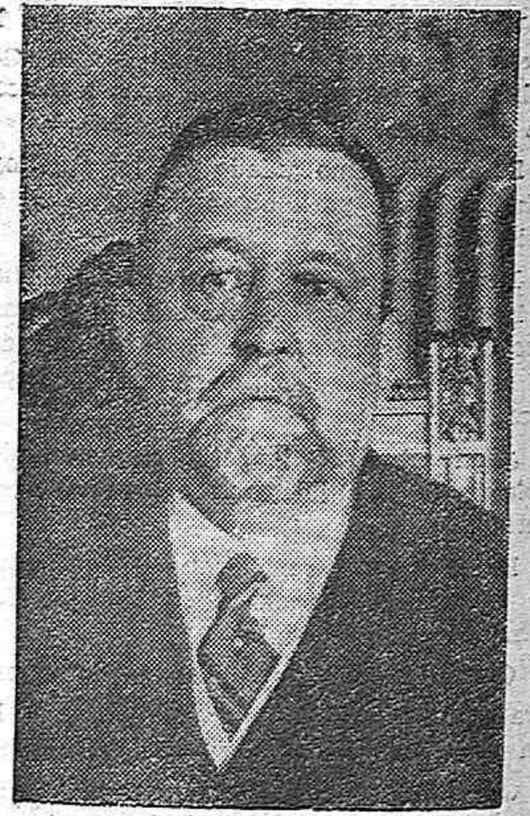
EL CONDE DE BUGALLAL, MINISTRO DE ECONOMIA

De todos es conocida la historia política de don Manuel García Prieto, a quien le cupo en la historia el momento nacional de ser sustituido por la Dictadura del glorioso general Primo de Rivera.