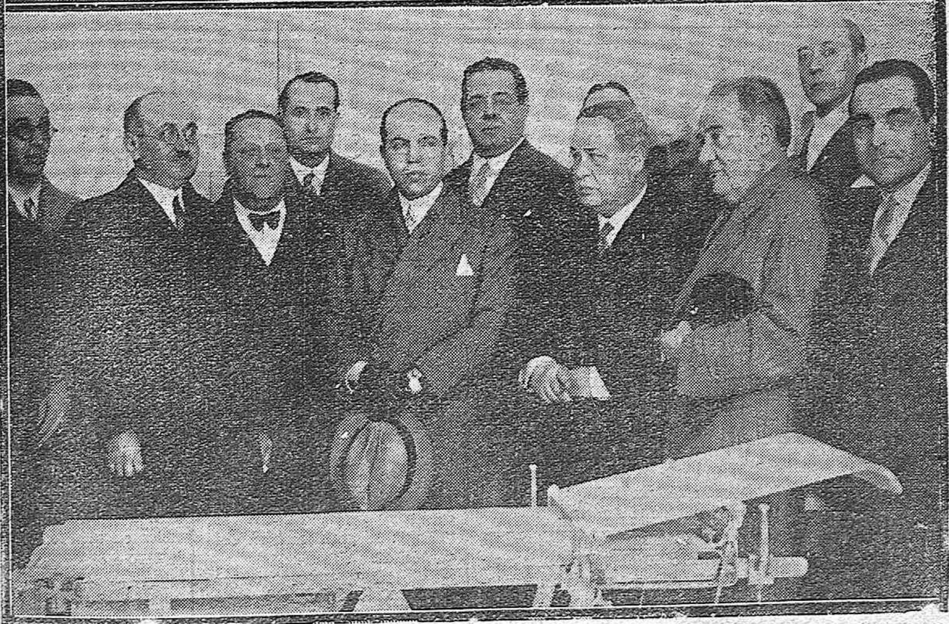
El Alcalde y demás personas que asistieron a la inauguración de la Casa de Maternidad Municipal y enfermería de vagones del Asilo de Madre de Dios.