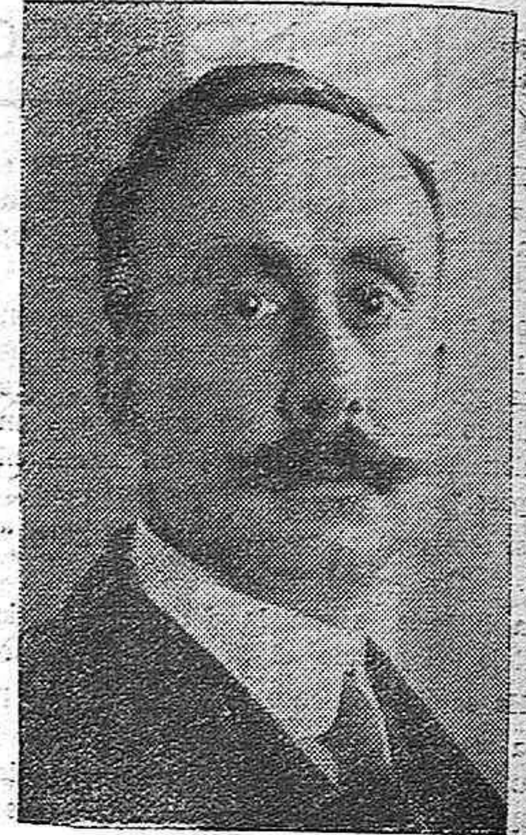
DON JUAN VENTOSA Y CALVET, MINISTRO DE HACIENDA

Presidente del Consejo desde la caída de la Dictadura. Por estar tan reciente su gestión presidencial omitimos todo detalle de la vida política del general; cuya gestión, de una gran responsabilidad, merecerá en su día el fallo de la Historia.