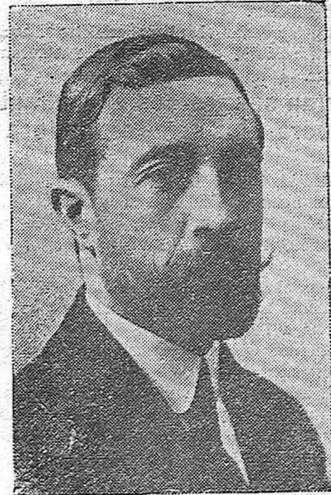
GASCON Y MARIN, MINISTRO DE INSTRUCCION

Militar pundonoroso, no figuró nunca en política. No obstante Berenguer le nombró alcalde de Madrid, donde destacó su labor. Es Presidente de la Cruz Roja Española. Perteneció a la Asamblea Consultiva.