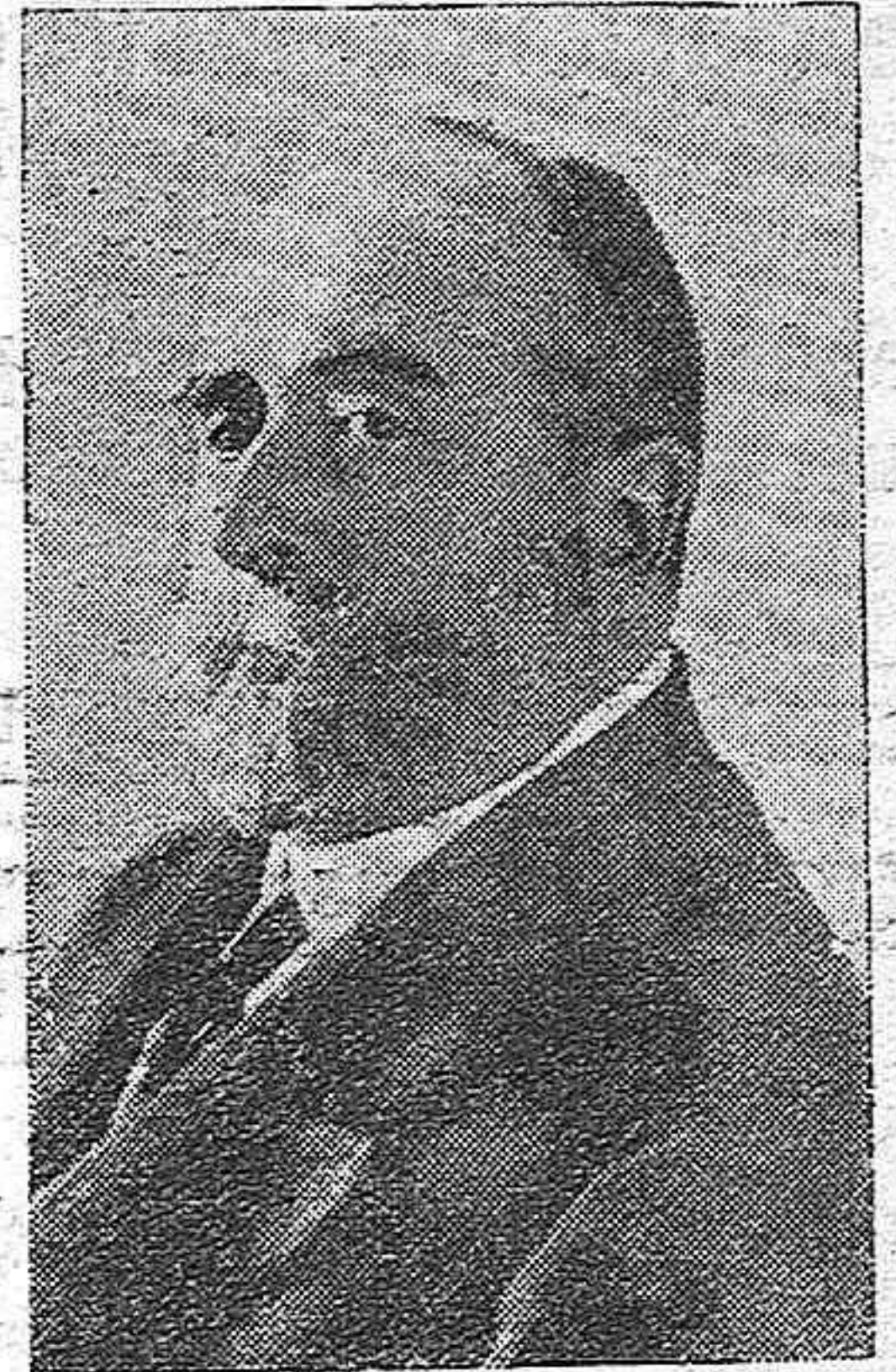
DON JUAN LA CIERVA Y PEÑAFIEL, MINISTRO DE FOMENTO

Don Alvaro de Figueroa, ha llenado más de un cuarto de siglo la historia parlamentaria de España. La labor del Conde en Estado, hay razones para esperar que sea fructífera dadas las buenas relaciones personales del ministro en las chancillerías europeas.