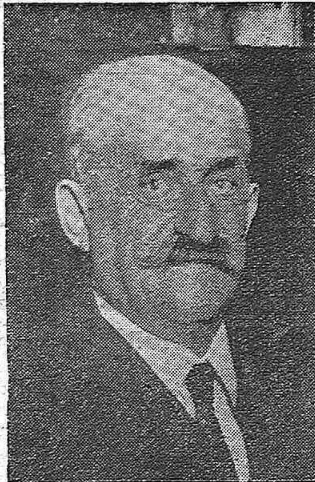
CONDE DE ROMANONES, MINISTRO DE ESTADO

En el prestigio de su apellido y en la consecuente colaboración con su ilustre padre, lleva el duque de Maura el aval de su labor futura. Su gran capacidad política estará en todo momento al servicio de la Patria. Perteneció a la Asamblea Consultiva.