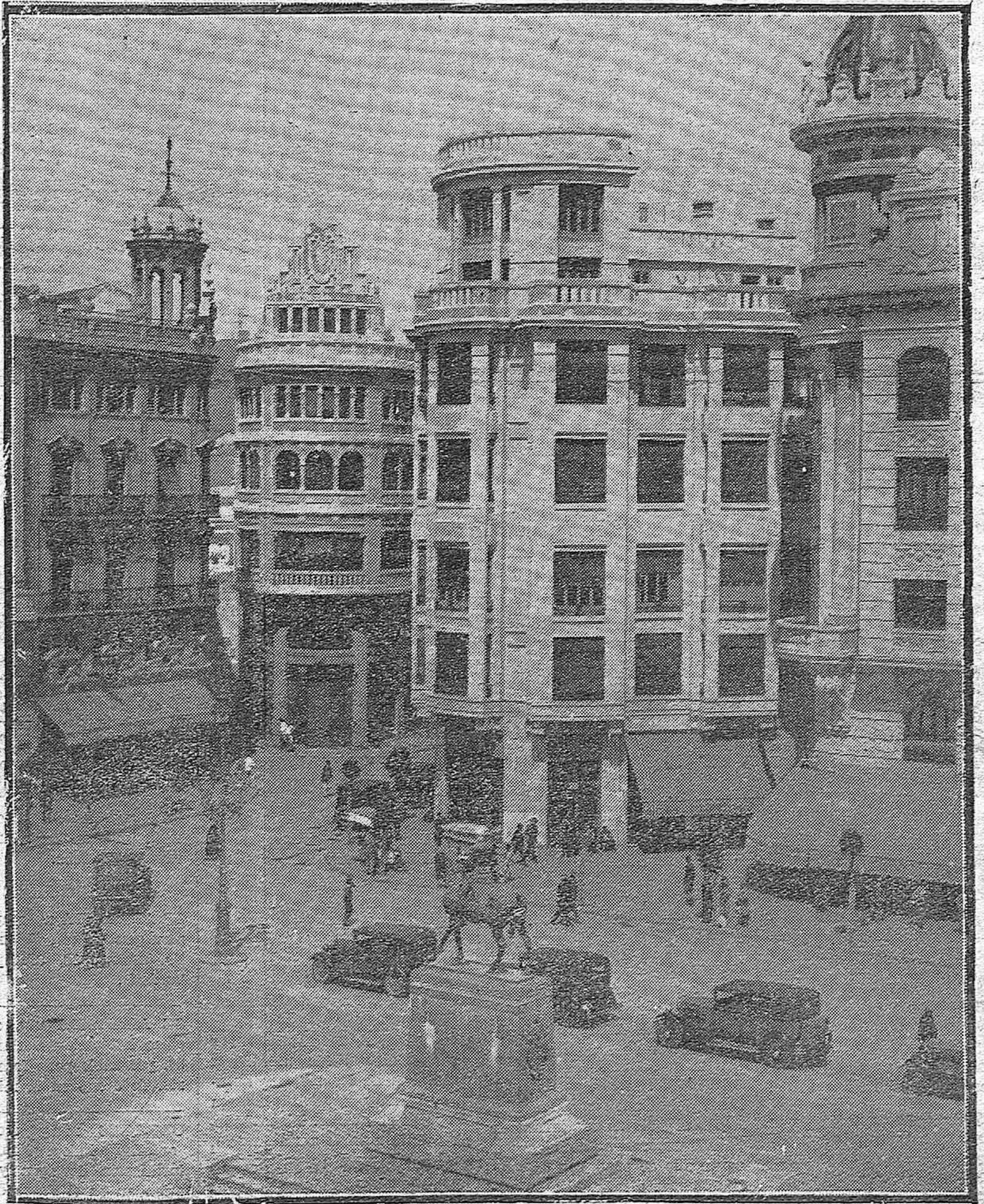
LOS PROGRESOS DE NUESTRA CIUDAD.—Verdadero aspecto de ciudad moderna que ofrece este ángulo de la plaza de las Tendillas, después de su urbanización.